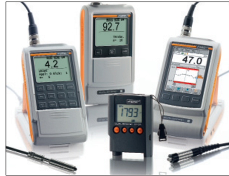
ISOSCOPE®, DELTASCOPE® 和 DUALSCOPE® 手提式仪器, 配有内置探头或外置独立探头, 可在现场快速简便测量涂镀层厚度

本宣传册中的信息包含了一般化的描述或性能特点, 可能并不适合所有已描述的具体应用, 或是由于产品更新会有更改。这些性能特征只有在合同中表述才具有约束力。DELTASCOPE®, ISOSCOPE®, DUALSCOPE®, FISCHERSCOPE®, FERITSCOPE®, MMS® 和 XDAL® 是德国Helmut Fischer GmbH Institut für Elektronik und Messtechnik的注册商标。