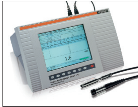
FISCHERSCOPE® MMS® PC, 通用测量平台系统, 可采用磁感应、电涡流和β背散射法进行涂镀层厚度测量和常见材料测试