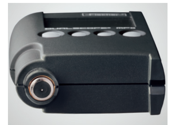
表面有硬质镀层的内置探头，底座和探头处配以V型凹槽，可测量圆柱形工件。

操作手册有多种语言可选。 保护罩（订货号：603-582）可供选择。 *也作为替换件供选择