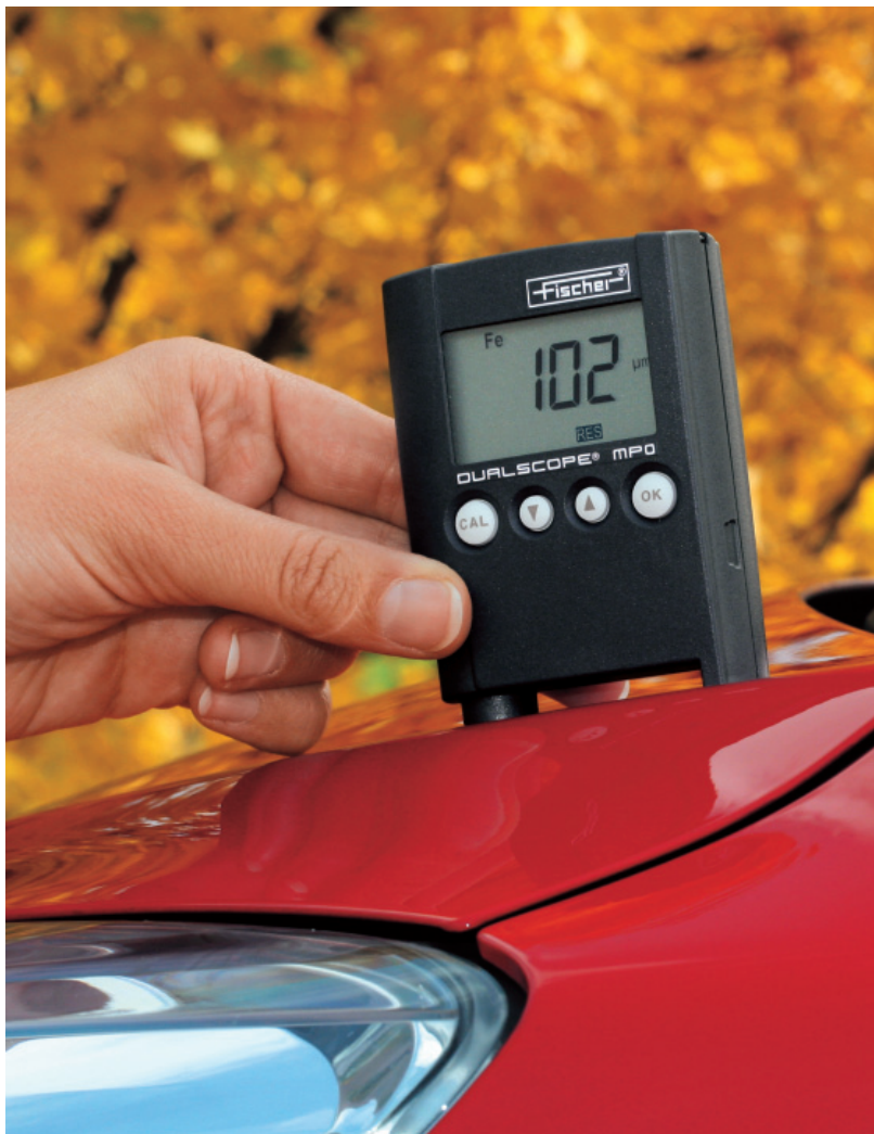
使用DUALSCOPE® MP0检测油漆厚度，例如：汽车车身

新款DUALSCOPE® MP0采用广受认可的Fischer探头技术，是最为小巧并能最大程度满足您测量需要的仪器。它测量精度高、界面友好且结实耐用。对不复杂工件的现场测量尤为理想。内置探头，采用磁感应及电涡流方法，可快速无损地测量涂镀层厚度。DUALSCOPE® MP0自动识别基材例如铁或铝并选择适合的测量方法。可显示最重要的统计参数。由于有着出色的重复精度及统一标准的校准功能，使得这款仪器在同级别产品中无与伦比。