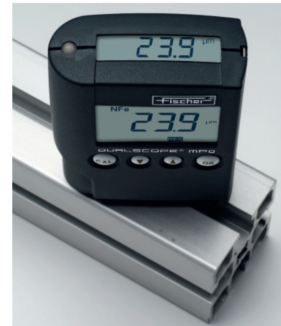
测量铝上阳极氧化膜的厚度