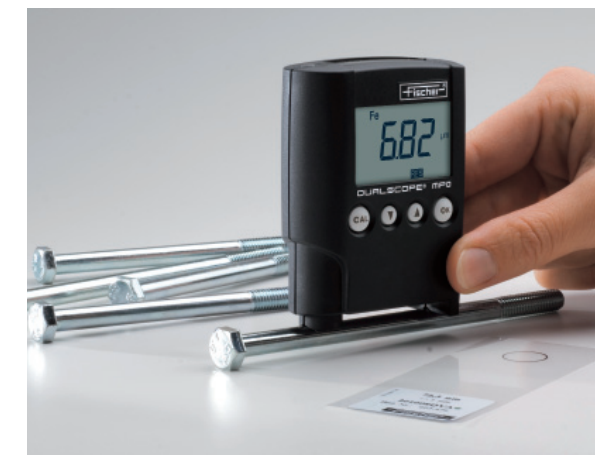
测量铁上镀锌层的厚度，测量小曲率工件必须进行校准以获得准确的测量结果