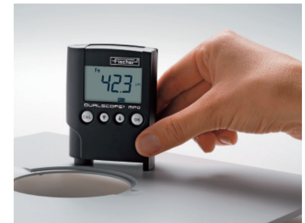
测量铁上油漆的厚度