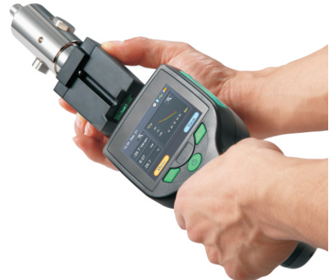
传感器单元可拆分便于再校准/交换