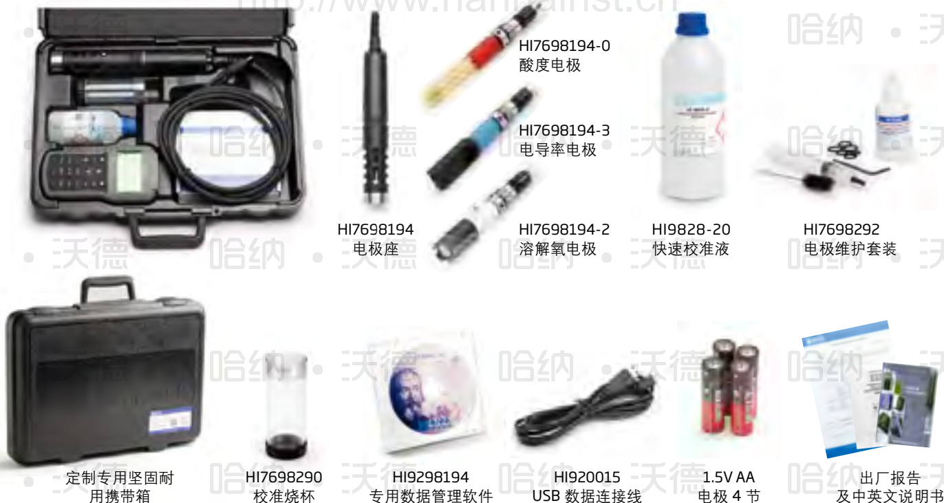
定制专用坚固耐用携带箱

Tel: 400-668-1217 http://www.hannainst.cn