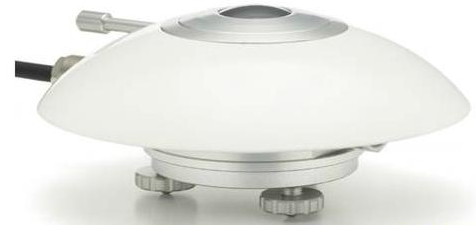
北京华益瑞科技有限公司