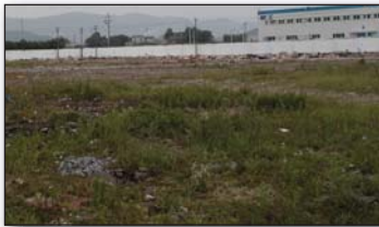
Zhenjiang, China. Ground Zero, May 2005

如今，客户常常更为关注与怀特驱动产品有限公司形成的关系，而不再是和我们的商业竞争对手形成的关系。尽管我们已经成长为最大的摆线马达的独立制造商，但是我们依然传承历史，依然牢记我们的事业是从怀特家的地下室开始为我们的客户提供优异的产品服务的。