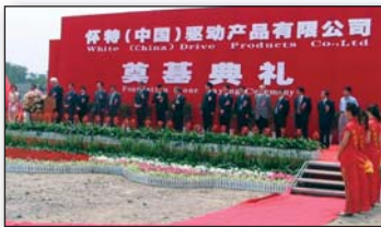
Foundation Stone Laying Ceremony, June 2005