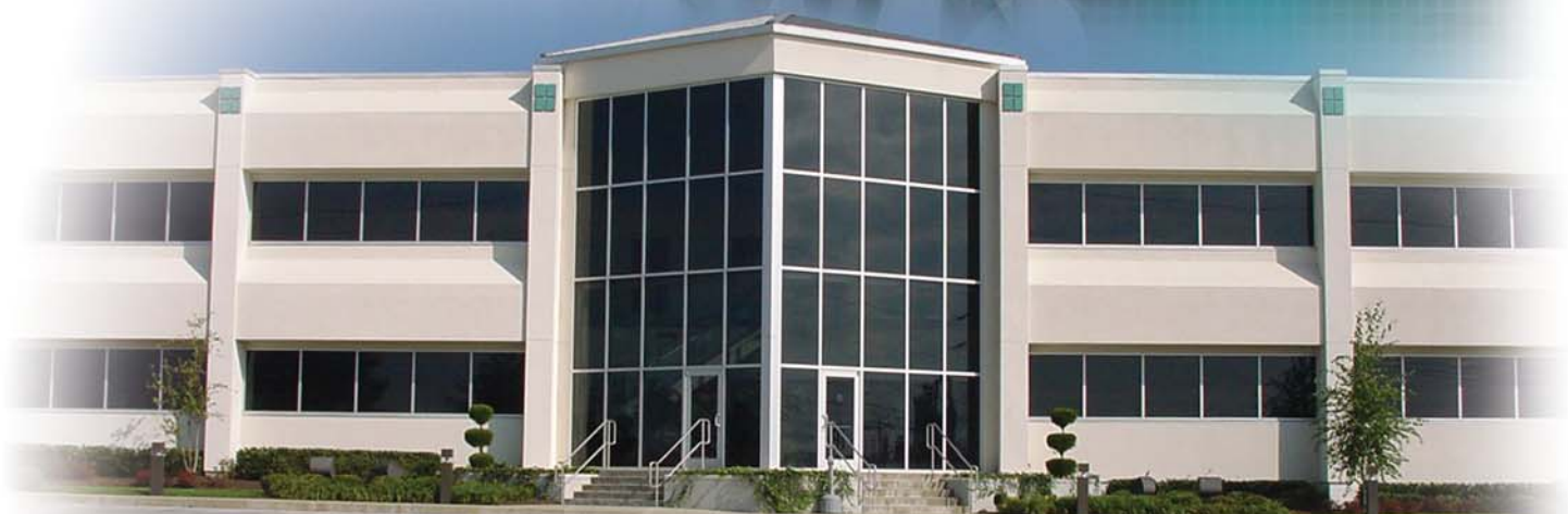
White Drive Products World Headquarters, Hopkinsville, KY