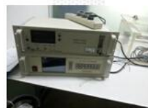
红外线气体分析仪