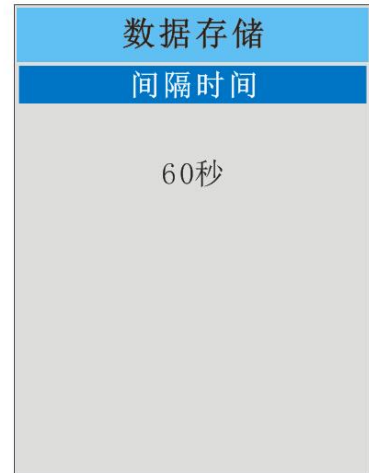
图-20 数据存储的间隔时间

最后还可选配温湿度功能，根据现场的温湿度，自动进行感应。另有延长式探杆可以提供，可延长 1 米探杆，上至屋顶、下至角落，自由伸缩，无所不能；可以说，深国安便携式汽油检测仪是当前国内行业中最先进、最智能的一款气体浓度检测报警产品。