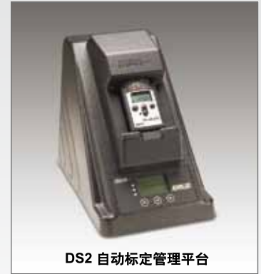
DS2 自动标定管理平台