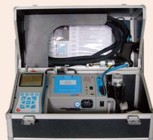
ecom • J2KN B版本