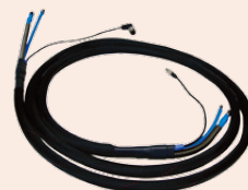
可选NO x 管线 PTFE材料3.5m和5m, 防止NO x 和SO 2 吸附