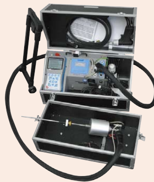
可选加热采样系统