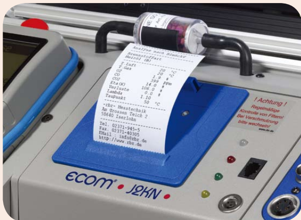
免维护的高速热敏打印机