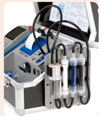
可选高尘前置过滤器单元