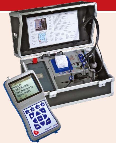
ecom-J2KN 远程控制模块，移动手操器