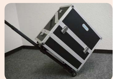
铝合金框架仪表箱