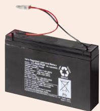
大容量铅酸蓄电池 充足电可工作约6小时