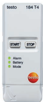
testo 184 T4