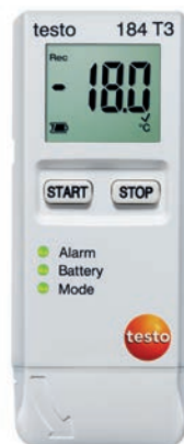
testo 184 T3