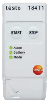
testo 184 T1