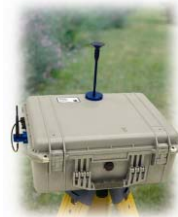
8535 型环境保护箱 (选件)