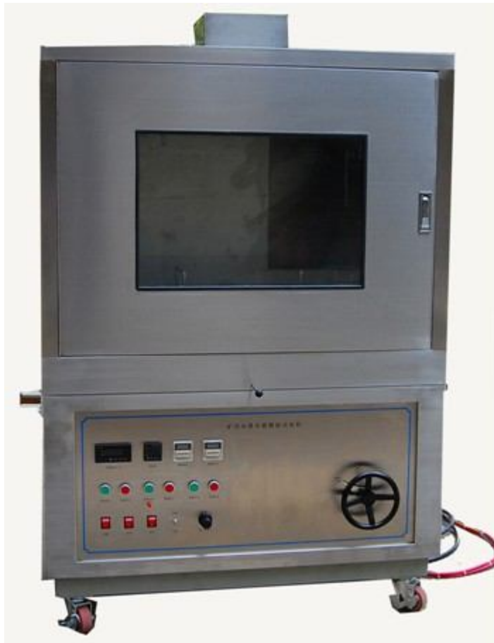
K-R386 煤矿用电缆负载燃烧试验机