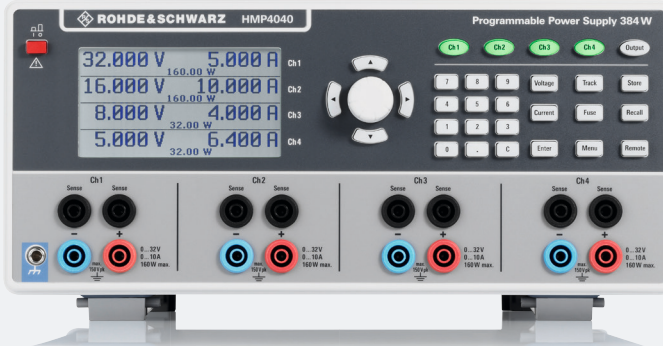
R&S®HMP2030 3通道电源和 R&S®HMP4040 4通道电源