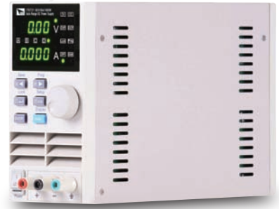
IT6720 60V/5A/100W IT6721 60V/8A/180W