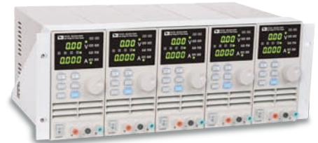
IT-E152 19 机框安装