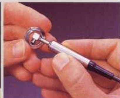
微型探头用于小工件及难以测量区域