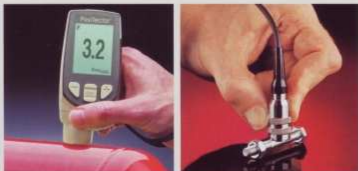
测量金属上油漆及粉末涂料等的厚度