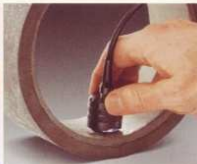
大量程探头, 用于测量厚涂层如防火层, 缸内衬等