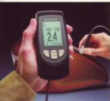
此图展示的是标准型仪器在带减震保护套时进行测量工作