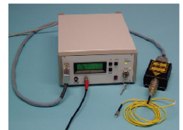
皮秒半导体激光器