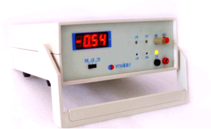
WT30A基础型数字磁通计

WT30A 数字磁通计是测量磁铁磁通量的专用仪器，配合专用线圈可测量产品整体性能。该款仪器稳定性高，漂移低，抗干扰能力强。多用于在线测量。