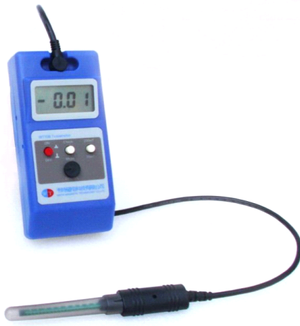
WT10B基础型手持式数字高斯计/特斯拉计