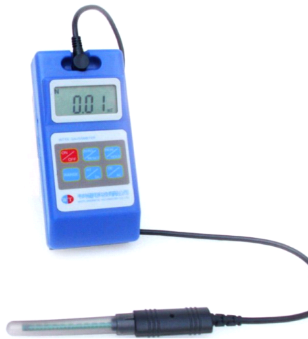
WT10C智能手持式数字高斯计/特斯拉计