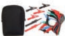
便携包 P/N IO620-CASE-1