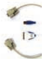
USB 转 RS232 电缆 P/N IO620-USB-RS232