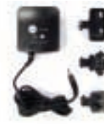
充电器 P/N IO620-PSU