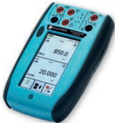
测量、输出 mA、mV、V、电阻、频率、热电阻和热电偶