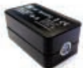
IDOS 转 USB P/N IO620-IDOS-USB