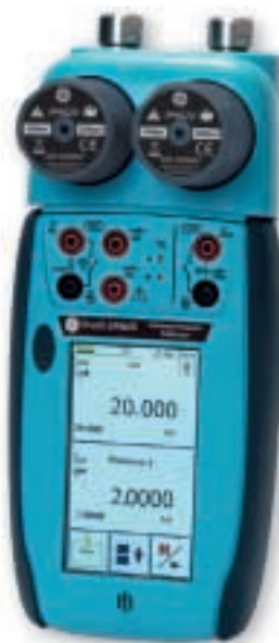
可换量程双通道压力校验仪，量程从 2.5 kPa ~ 100MPa