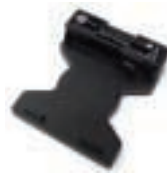
电池充电座 P/N IO620-CHARGER