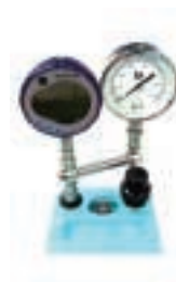
比较测试泵转换接头 P/N IO620-COMP