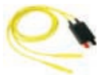
交流测试夹 P/N IO620-AC