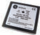
锂聚合物可充电电池 P/N IO620-BATTERY