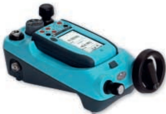
可换量程自产生压力校验仪，量程从 2.5kPa ~ 100 MPa

先进模块化校验系统 AMC 仅使用 3 个基本部件，提供了原先需要使用多种不同仪表才能实现的复杂功能。集世界级的压力校验仪，多功能过程信号校验仪于一体的模块化便携式校验系统。