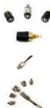
压力释放阀 压力接管 / 压力接头 套件