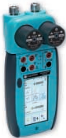
DPI 620 + MC 620 + PM 620

量程范围从 2.5 kPa ~ 100 MPa ( 10 inH 2 O ~ 15000 psi )，总体不确定度包含 1 年稳定性，0 ~ 50 ( 32 ~ 122 ° F ) 温度补偿。