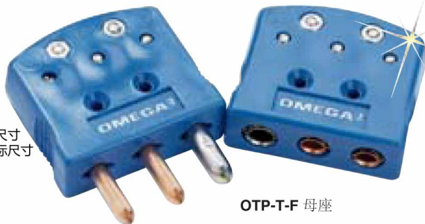
两个显示尺寸 越大于实际尺寸