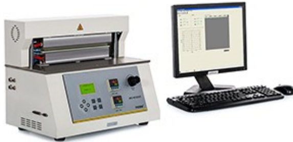
图 2 HST-H3 热封试验仪

本文利用 Labthink 兰光 HST-H3 热封试验仪进行试样热封参数的选择与研究。