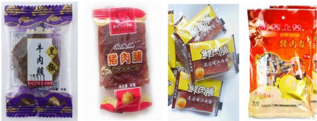
图 1 常见肉脯包装形式

肉脯被誉为闽南八干之首，采用传统工艺，经数十道工序精制而成，片形整齐，色泽鲜艳，鲜香诱人，在色香味俱全的基础上，兼具了营养丰富特点。肉脯包装良好的热封强度在保存肉脯的香味，保持其色泽的鲜亮及防止发霉变质等方面具有至关重要的作用。