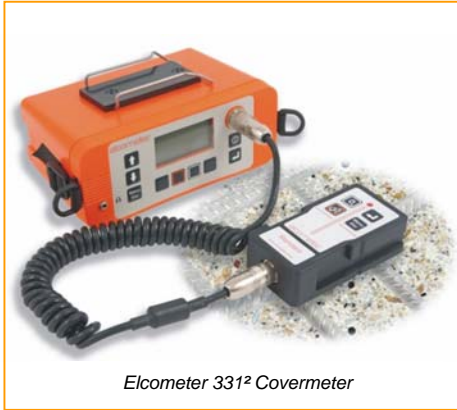
Elcometer 331 2 Covermeter