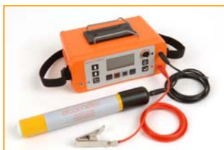
Elcometer 3312 带半电池探头

Elcometer 3312 保护层测试和半电池测试仪不仅可以定位钢筋位置和走向、保护层厚度、和钢筋直径，同时还可以根据半电池法测试钢筋锈蚀情况。