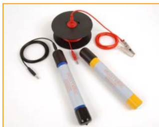
Elcometer 3312 半电池测试包

Elcometer 半电池测试装置： 包括铜/硫酸铜 (Cu/CuSO 4 )电极或银/氯化银电极(Ag/AgCl)。每个半电池都是密封装置，因此不需要在现场配置化学溶液。测试包中带 25m 测试线，每个半电池测试包质保期为 5 年。