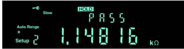
DMM4020 上的极限比较模式。

专用前面板按钮可以快速进入常用的功能和参数，缩短仪器设置时间。您不必再搜索软件菜单，查找所需的功能。