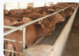
养殖场等防偷盗自动 红外监控

在野生动物调查、农林科学院、进行动植物调查，生态监测，自然保护区监测；生态摄影爱好者、野外侦测自动照相录像；苗圃、动物养殖场、鱼塘、果园等；防偷盗猎捕的自动红外监控仓库、办公室监控、家庭内部秘密监控及家居物业防偷盗取证等各个领域使用。