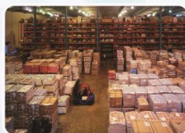
仓库、办公室等监控