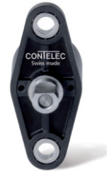
Vert-X 16 订购代码 版本 C