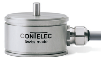
Vert-X 51 - 5V / SPI 订购代码