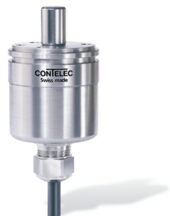
Vert X 37 24V 05 45V