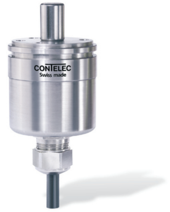
Vert-X 37 - 5V / 10...90% Ub