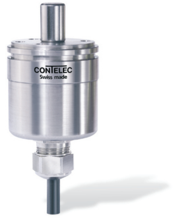
Vert-X 37 - 5V / 10...90% Ub 订购代码