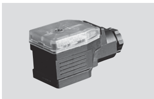
信号转换器 MUW ... , 一体化接头, 工作电压 24V, 标准信号输出