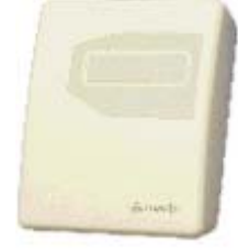
VC1008-BD IP20 壁挂式 (带 LED 点显示)