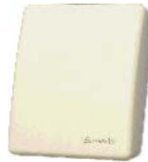
VC1008 IP20 壁挂式 (不带显示)

用 VC1008 于智能型通风系统控制，对节约能源和改善室内空气品质有很好的平衡作用。