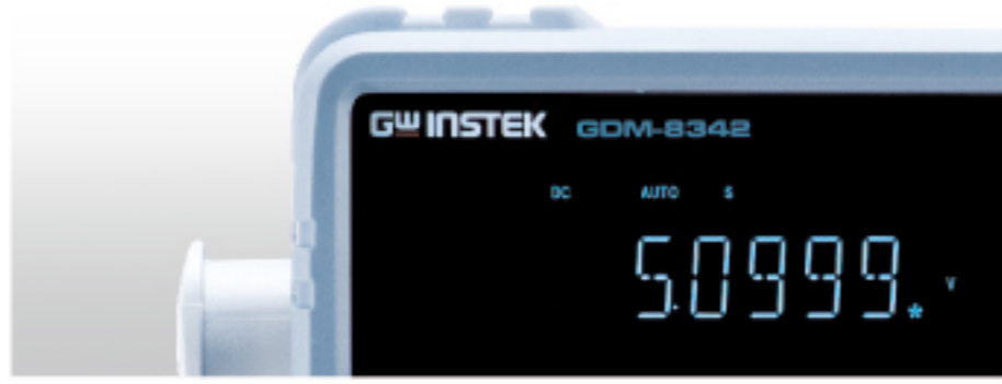
速度不同并不会影响显示位数