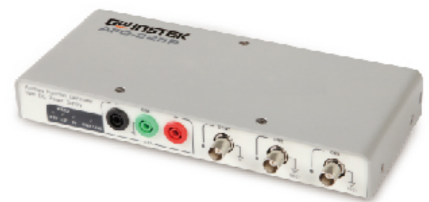
USB任意波信号发生器/ GDS-2000A系列混合型数字示波器信号源选件