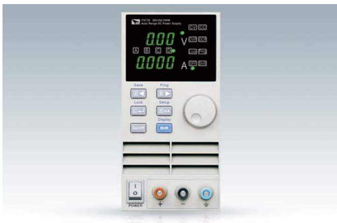
IT6720 60V/5A/100W IT6721 60V/8A/180W