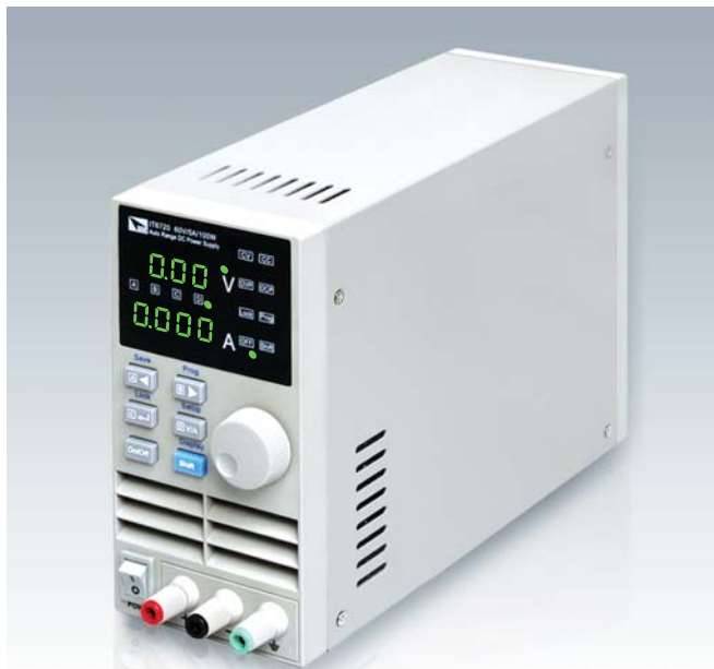
IT6720 60V/5A/100W IT6721 60V/8A/180W