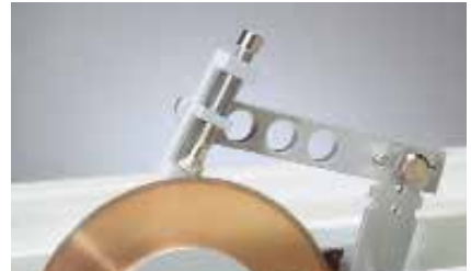
11-2482 紧固件夹具，易于沿纵向切割螺钉。