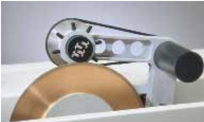
11-2181 可转动台钳夹具，用于切割难切材料。