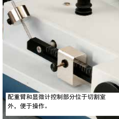
配重臂和显微计控制部分位于切割室外，便于操作。