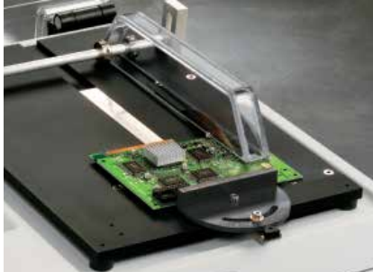
11-2182 T台面切割附件，能够有效地切割或修整生物材料或电子零部件。