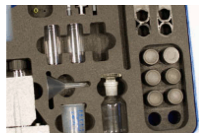
Qualitative 定性试纸, VISOCOLOR® QUANTOFIX® 测试条, pH-Fix 测试条, pH 试剂瓶