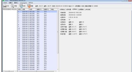
数据报表和数据统计