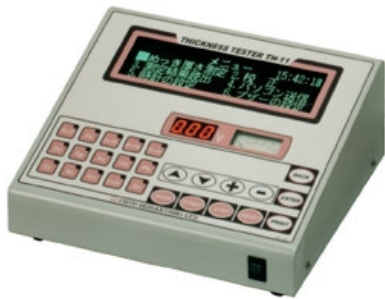
TH-11Main Unit 主機