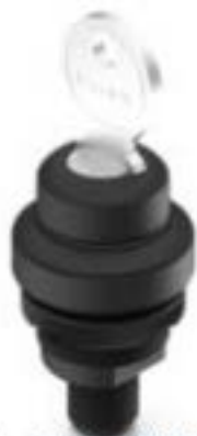
RAMO 22 K, M12, 圆形卡圈, 1 开 + 1 关, 金触, M12 4-极 A-编码, 前圈黑色, 1 x 90°, L 形, 声感的, 拔出位置 0+1