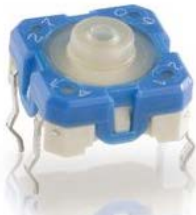
RACON 8, THT在外, 4.8 \pm 0.8 N, 1 关