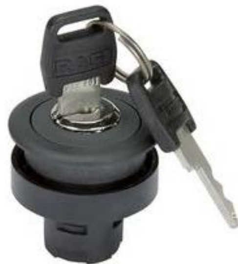
RAFIX 16 F, 钥匙开关, 圆形卡圈 2 x 90°, 声感的