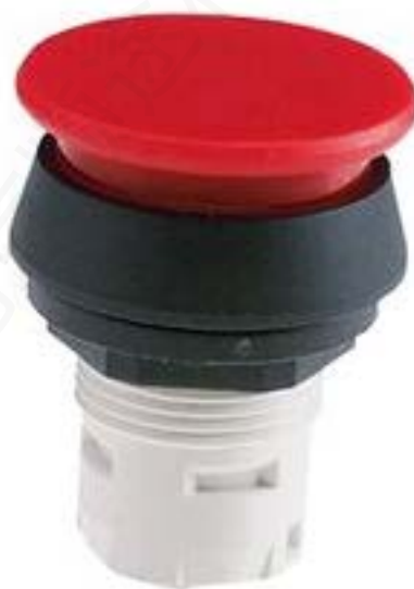
RAFIX 16 蘑菇头按钮, 圆形卡圈