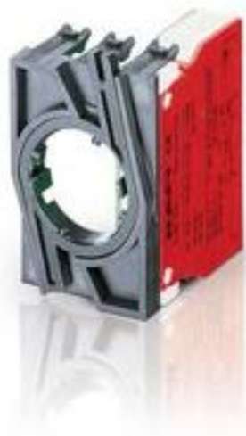
RAFIX 22 QR, 触点模块, 螺丝接口, 金触, 带连接器, 1 开 + 1 关, 1 开 + 1 关