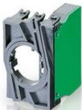
RAFIX 22 QR, 触点模块, 螺丝接口, 银触, 带连接器. 用于 BA9s, 1 关 + 1 开