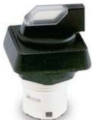
RAFIX 16, 发光选择开关, 正方形卡圈, 2 x 60°, 声感的