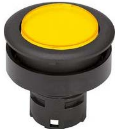
RAFIX 16 F, 发光按键, 平灯罩, 圆形卡圈 灯罩 黄色