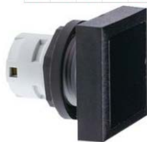
RAFIX 16, 按键, 平灯罩, 正方形卡圈. 灯罩 黑色