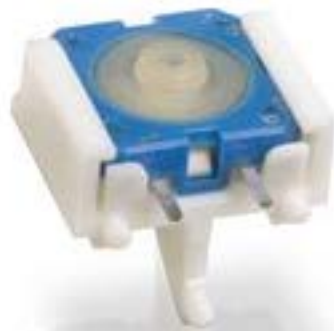
RACON 12 V 带纵向适配器, 3,6 \pm 0,7 N, 1 关