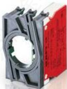
RAFIX 22 QR, 触点模块, 笼扣弹簧, 金触, 带连接器. 用于 BA9s, 1 关