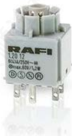
RAFIX 16, 通用触点模块, 金触, 带 灯座, 快插端子. 用于 W 2 x 4.6d. 1 关