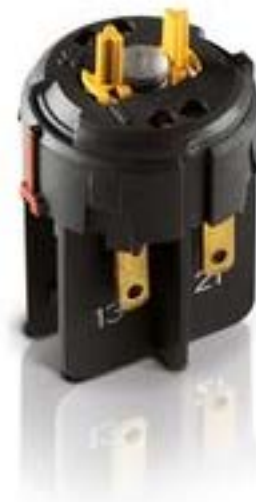
RAFIX FS QC急停触点模块, 银触, 光导体, 用于 LED-夹, 2 关