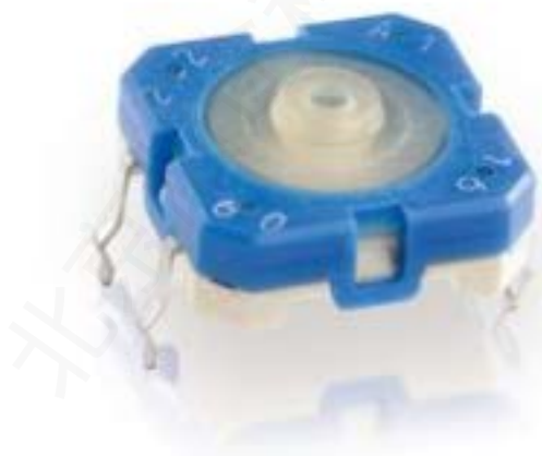
RACON 12, THT在外, 3.6 \pm 0.7 N, 1 关