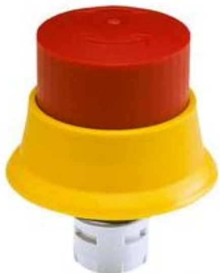
RAFIX 16, 急停, 圆形卡圈, 防锁闭, 复位通过旋转