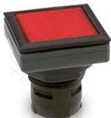
RAFIX 16 F, 发光按键, 平灯罩, 正方形卡圈. 灯罩 绿色