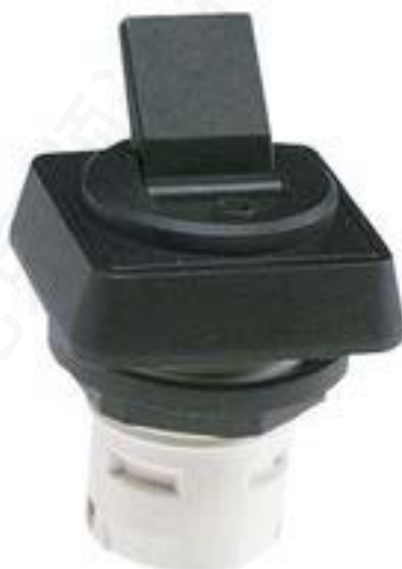
RAFIX 16, 扳钮开关, 正方形卡圈, 声感的