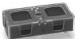
KN 19, 2 关, 14 \pm 3 N