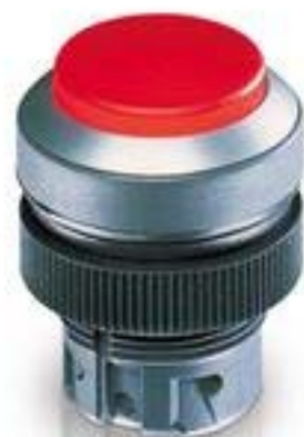
RAFIX 22 QR, 按键, 突起的灯罩, 圆形卡圈. 触感的. 前圈 蓝色. 灯罩 绿 色