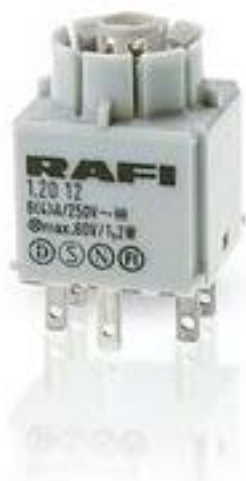
RAFIX 16, 标准触点模块, 银触, 无灯座, 快插端子. 1 开 + 1 关