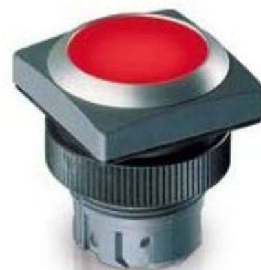
RAFIX 22 QR, 发光按键, 平灯罩, 正方形卡圈. 声感的. 前圈 银灰色. 灯 罩 黄色