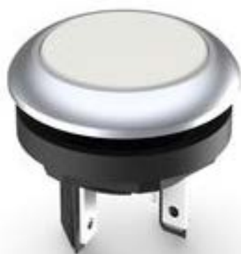
LUMOTAST 16, 按键, 圆形卡圈, 触感的, 前圈 银金属色, 1 关, 灯罩 白色