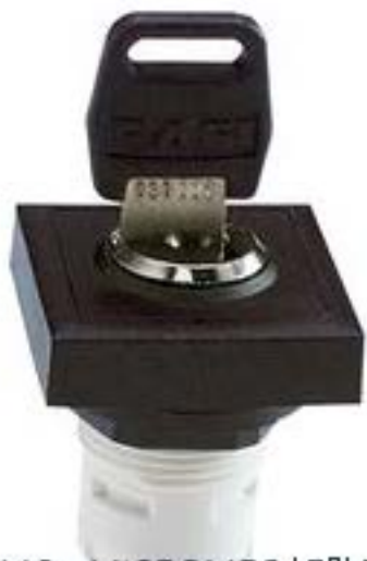
RAFIX 16, MICROMECC 钥匙开关, 可排列式正方形卡圈, 2 x 90°, 声感 的. 拔出位置 0+1+2