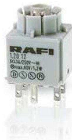
RAFIX 16, 标准触点模块, 金触, 带灯座, 快插端子. 用于 W 2 x 4.6d. 2 关