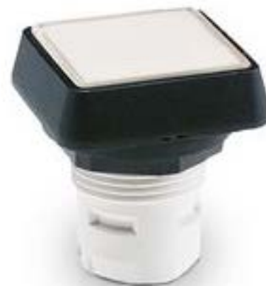
RAFIX 16, 按键, 平灯罩, 正方形卡 圈. 灯罩 黄色