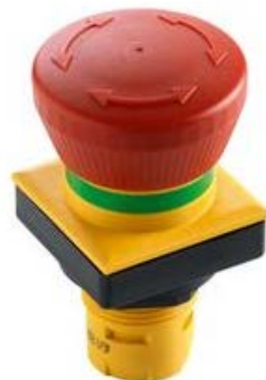
RAFIX 16 F, 急停按钮, 正方形卡圈, 复位通过旋转