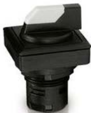
RAFIX 16 F, 发光选择开关, 正方形 卡圈. 1 x 90°, V形. 声感的