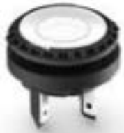
LUMOTAST 16, 发光按键, 圆形卡圈, C-LAB, 触感的, 1 关