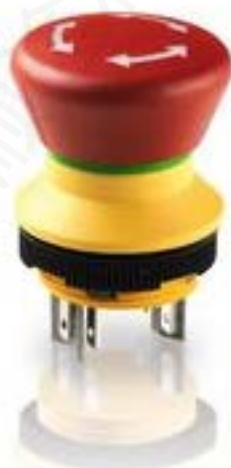
LUMOTAST 22, 急停按钮, 银触, 快 插端子 2.8 x .8, 镀锡, 复位 通过旋 转, 箭头 白色