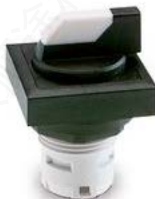
RAFIX 16, 发光选择开关, 可排列式正方形卡圈, 2 x 40°, 触感的