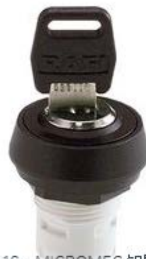
RAFIX 16, MICROMECC 钥匙开关, 圆形卡圈. 1 x 90°, V 形. 声感的. 拔 出位置 0+1