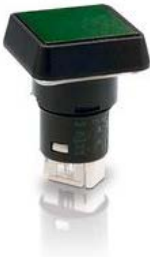
LUMOTAST 25, 发光按键, 平灯罩, 螺圈, 外壳, 触感的, 1 关