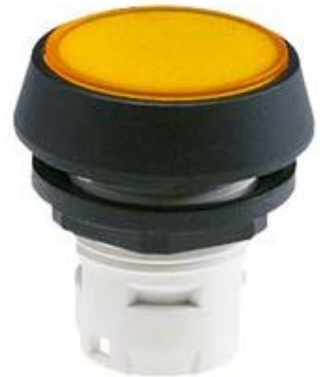
RAFIX 16, 发光按键, 平灯罩, 圆形 卡圈 灯罩 黄色