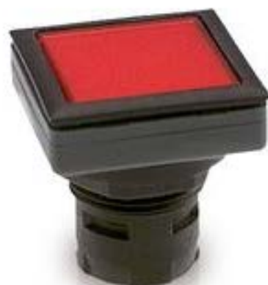
RAFIX 16 F, 发光按键, 平灯罩, 正方形卡圈. 灯罩 蓝色