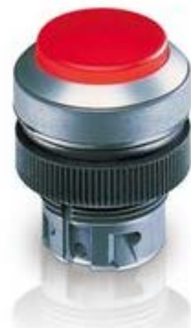
RAFIX 22 QR, 按键, 突起的灯罩, 圆形卡圈, 触感的, 前圈银灰色, 灯罩 黑色