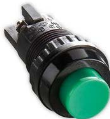
按键, 16.2 mm. 触感的. 1 关. 灯罩黑色