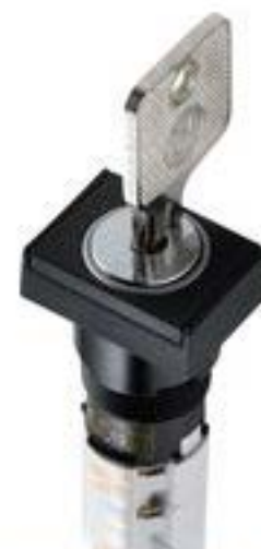
LUMOTAST 75 IP40, 钥匙开关, 方形卡圈, 1 开 + 1 关, 银触, 焊接端子, 45°, 触感的, 拔出位置 0