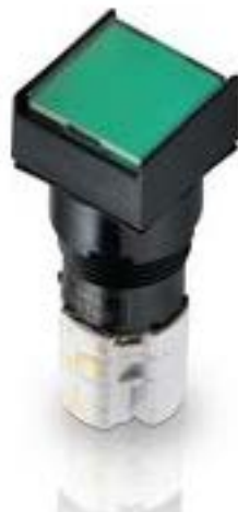
LUMOTAST 75 IP65, 发光按键, 正方形卡圈, 平灯罩. 声感的. 1开 + 1关