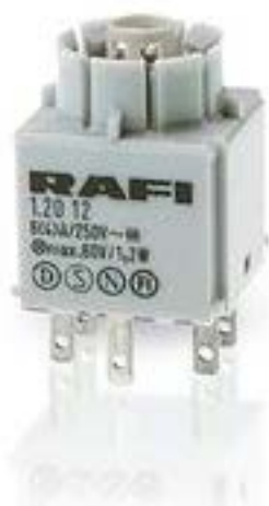
RAFIX 16, 通用触点模块, 金触, 带 灯座, 快插端子. 用于 W 2 x 4.6d. 1 开 + 1 关