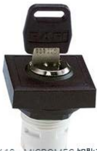
RAFIX 16, MICROMECC 钥匙开关, 可排列式正方形卡圈. 1 x 90°, V 形. 声感的. 拔出位置 0