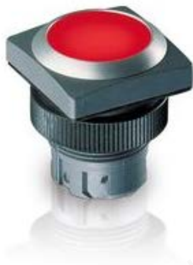
RAFIX 22 QR, 按键, 平灯罩, 正方形卡圈, 触感的, 前圈红色, 灯罩红色