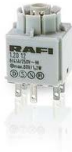
RAFIX 16, 标准触点模块, 金触, 无灯座, 快插端子, 1 开 + 1 关