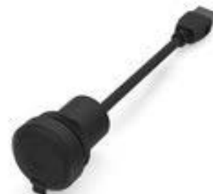
RAMO 22 F, USB, 圆形卡圈. 前圈黑色. USB 3.0 型号A 带电缆55 cm