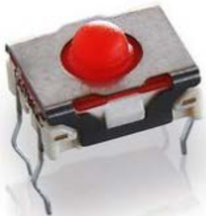
MICON 5, THT 标准型, 3.6 N, 1 关