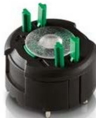
RAFIX FS 通用触点模块PCB, 银触, 用于 SMT LED, 2 开