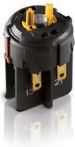
RAFIX FS 急停触点模块QC, 金触, 2 关