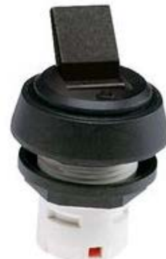
RAFIX 16, 扳钮开关, 圆形卡圈, 声感的