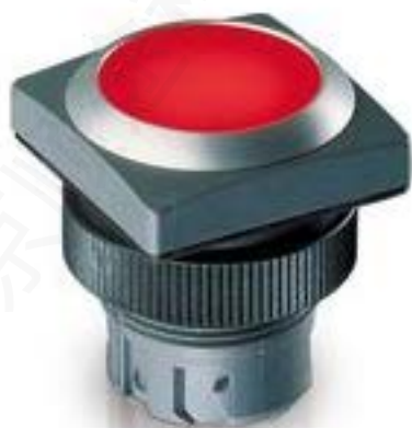
RAFIX 22 QR, 发光按键, 平灯罩, 正方形卡圈. 声感的. 前圈 绿色. 灯罩 红色