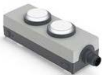
E-BOX M12, 2个发光按键 FLEXLAB, 前圈 银金属色