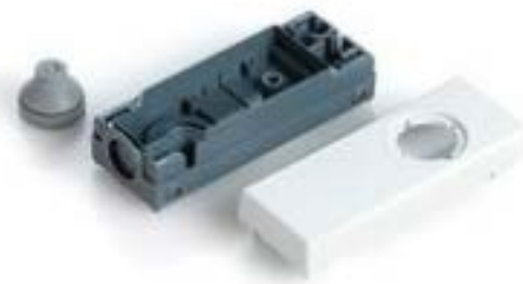
E-BOX 模块, 外壳, 35 V, 22.3 mm, 底面 M20, 浅灰色