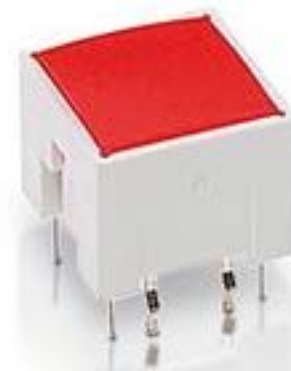
RACON 12 i, THT, 3,3 \pm 0,6 N, 灯罩 橙色, 1 关