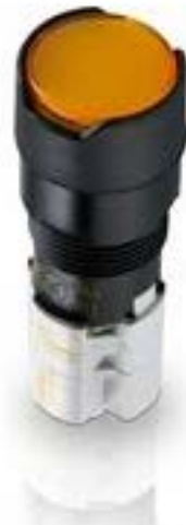
LUMOTAST 75 IP65, 发光按键, 圆形卡圈, 平灯罩, 声感的, 2 开 + 2 关