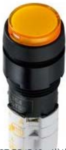
LUMOTAST 75 IP40, 发光按键, 圆形卡圈, 突起的灯罩. 触感的. 2 开 + 2 关