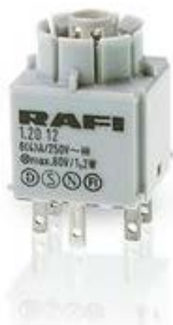
RAFIX 16, 通用触点模块, 银触, 无灯座, 快插端子. 1 开 + 1 关