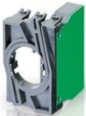
RAFIX 22 QR, 触点模块, 笼扣弹簧, 银触, 带连接器. 用于 BA9s. 1 开