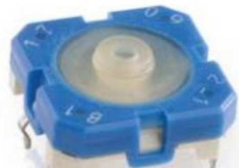
RACON 12, THT在内, 6.8 \pm 1.6 N, 1 关