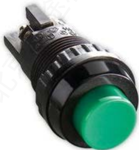
按键, 16.2 mm, 触感的, 1 关, 灯罩 红色