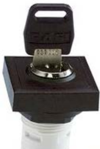
RAFIX 16, MICROMECC 钥匙开关, 可排列式正方形卡圈. 2 x 90°. 声感 的. 拔出位置 0