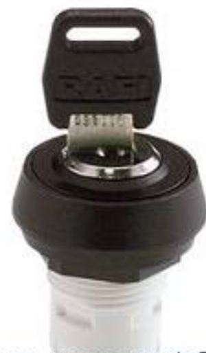
RAFIX 16, MICROMECC 钥匙开关, 圆形卡圈, 2 x 40°, 触感的. 拔出位置 0