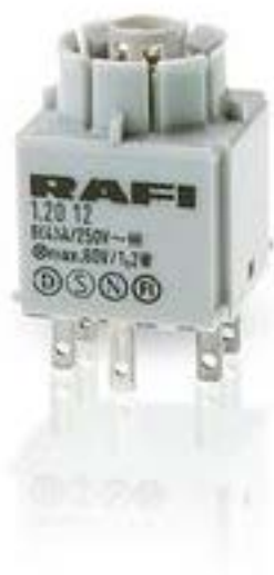
RAFIX 16, 标准触点模块, 金触, 无灯座, 快插端子, 2 关