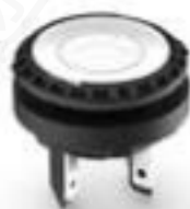
LUMOTAST 16, 按键, 圆形卡圈, C-LAB, 触感的, 1 关