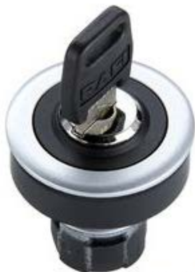
RAFIX 16 F, 钥匙开关, 圆形卡圈 2 x 90°, 声感的