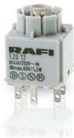
RAFIX 16, 通用触点模块, 银触, 无灯座, 快插端子. 1 开