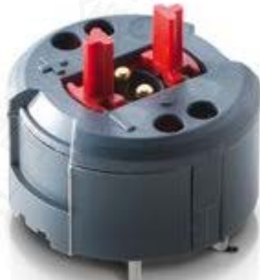
RAFIX FS 急停触点模块PCB，金触， Plus1, 2 开 + 1 信号接触点