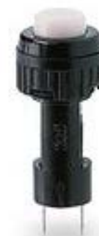
按键, 9.1 mm, 1 关, 触感的, 1 关, 灯罩 黑色