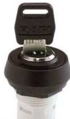
RAFIX 16, MICROMECC 钥匙开关, 圆形卡圈. 2 x 90°. 声感的. 拔出位置 0+1+2