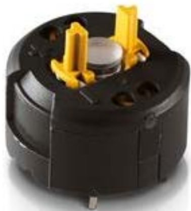
RAFIX FS 急停触点模块PCB, 银触, 用于 THT LED, 2 开