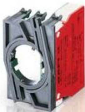
RAFIX 22 QR, 触点模块, 笼扣弹簧, 金触, 带连接器. 1 关, 1 关