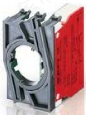
RAFIX 22 QR, 触点模块, 笼扣弹簧, 金触, 带连接器, 1 开