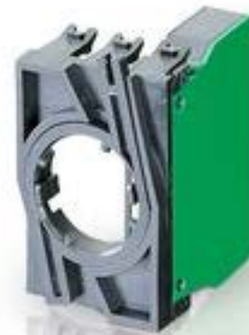
RAFIX 22 QR, 触点模块, 笼扣弹簧, 银触, 带连接器. 用于 BA9s. 1 开, 1 关