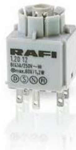
RAFIX 16, 通用触点模块, 银触, 带灯座, 快插端子. 用于 W 2 x 4.6d. 1 开 + 1 关