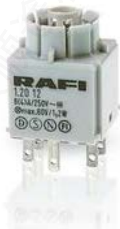
RAFIX 16, 通用触点模块, 金触, 无灯座, 快插端子, 2 关