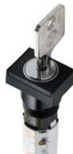
LUMOTAST 75 IP40, 钥匙开关, 方形卡圈, 2 开 + 2 关, 银触, 焊接端子, 90°, 声感的, 拔出位置 0