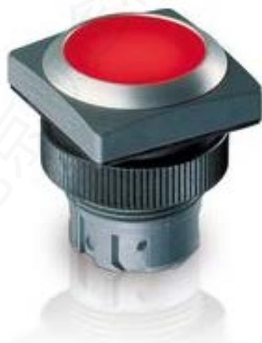
RAFIX 22 QR, 按键, 平灯罩, 正方形卡圈, 声感的, 前圈银灰色, 灯罩蓝色