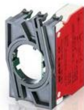
RAFIX 22 QR, 触点模块, 螺丝接口, 金触, 带连接器. 1 关