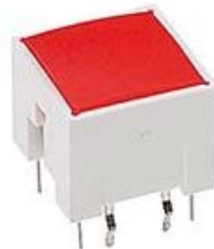
RACON 12 i, THT, 3,3 \pm 0,6 N, 灯罩 红色, 1 关