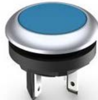
LUMOTAST 16, 按键, 圆形卡圈, 触感的, 前圈 银金属色, 1 关, 灯罩 蓝色