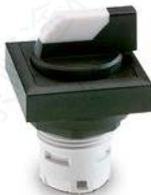
RAFIX 16, 发光选择开关, 可排列式正方形卡圈, 1 x 40°, 触感的