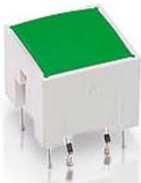
RACON 12 i, THT, 3,3 \pm 0,6 N, 灯罩 绿色, 1 关