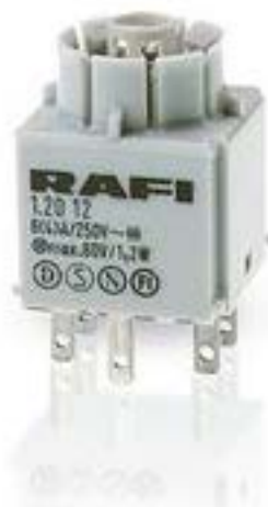
RAFIX 16, 通用触点模块, 银触, 带 灯座, 快插端子. 用于 W 2 x 4.6d. 2 开