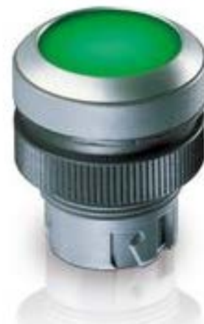
RAFIX 22 QR, 发光按键, 平灯罩, 圆形卡圈. 触感的. 前圈 绿色. 灯罩 黄 色