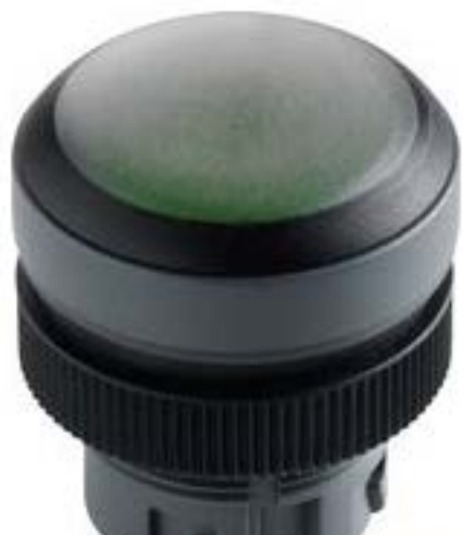
RAFIX 22 QR, 带防护罩的按键, 平 灯罩, 圆形卡圈, 触感的, 前圈 黑色, 灯罩 绿色