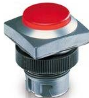
RAFIX 22 QR, 发光按键, 突起的灯罩, 正方形卡圈. 声感的. 前圈 绿色. 灯罩 绿色