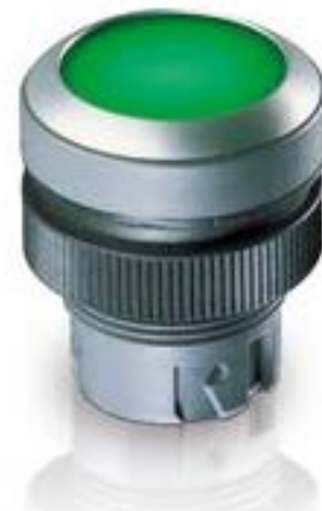
RAFIX 22 QR, 发光按键, 平灯罩, 圆形卡圈. 触感的. 前圈 黑色. 灯罩 黄 色