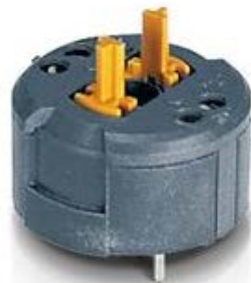
RAFIX FS 急停触点模块PCB，金触， 用于 THT LED, 2 关