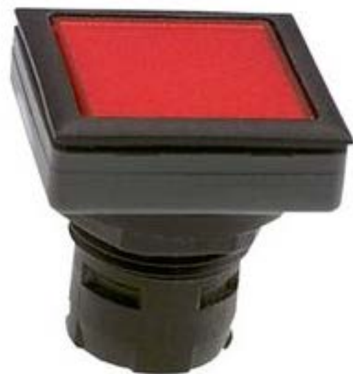
RAFIX 16 F, 发光按键, 平灯罩, 正方形卡圈. 灯罩 红色