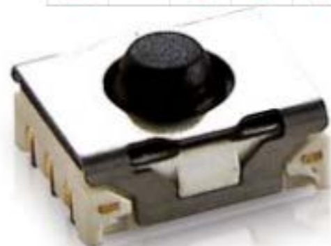
MICON 5, SMT在下方, 3.6 N, 1 关