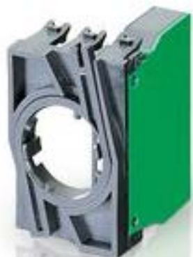
RAFIX 22 QR, 触点模块, 笼扣弹簧, 银触, 带连接器, 用于 BA9s, 1 关