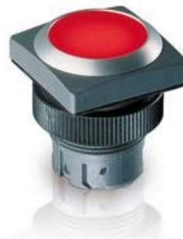
RAFIX 22 QR, 按键, 平灯罩, 正方形卡圈, 声感的, 前圈黑色, 灯罩石板灰色