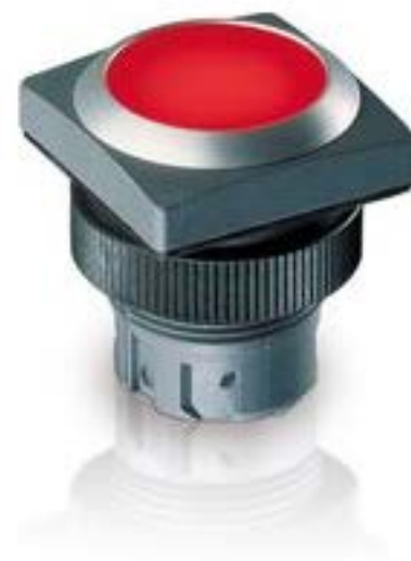
RAFIX 22 QR, 按键, 平灯罩, 正方形卡圈, 触感的, 前圈黄色, 灯罩红色