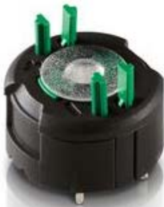
RAFIX FS 通用触点模块 PCB, 银触, 用于 SMT LED, 2 关