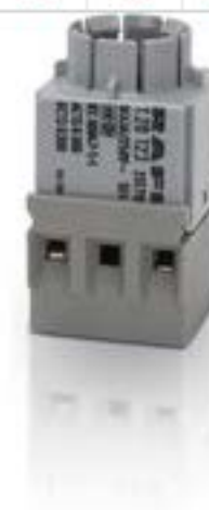
RAFIX 16, 通用触点模块, 银触, 带灯座, 螺丝接口, 用于 W 2 x 4.6d, 1 开 + 1 关