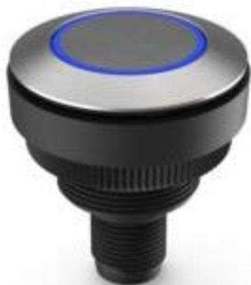
RAMO 30 T M12, 圆形卡圈, 环型 照明. 触感的. 前圈 不锈钢. 颜色 蓝 色. 1 关. 灯罩 不锈钢