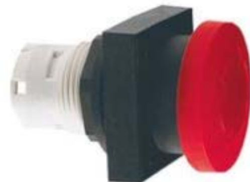
RAFIX 16, 急停, 正方形卡圈, 复位通过旋转