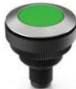
RAMO 30 T M12, 圆形卡圈, 触感的, 前圈 不锈钢, 1 关, 灯罩 绿色