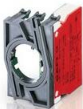
RAFIX 22 QR, 触点模块, 螺丝接口, 金触, 带连接器. 1 开