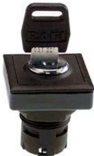
RAFIX 16 F, 钥匙开关, 正方形卡圈 1 x 90°, L形. 声感的