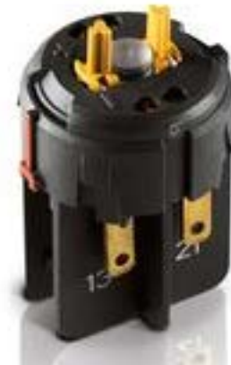
RAFIX FS 急停触点模块QC，金触，1 开