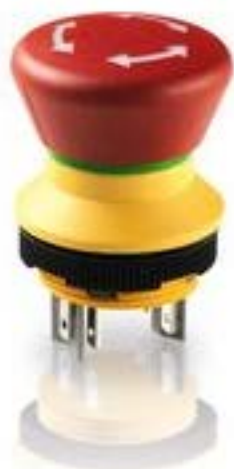
LUMOTAST 22, 急停按钮, 可发光, 2 开, 银触, 快插端子 2.8 x .8, 镀锡, 复位 通过旋转, 箭头 白色