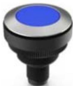
RAMO 30 T M12, 圆形卡圈, 触感的, 前圈 不锈钢, 1 关, 灯罩 蓝色