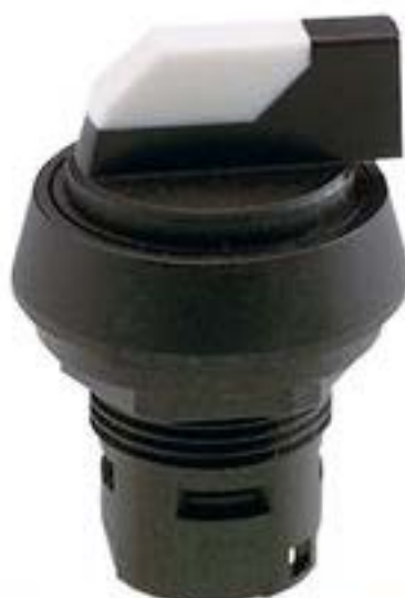
RAFIX 16, 选择开关, 圆形卡圈, 2 x 60°, 声感的