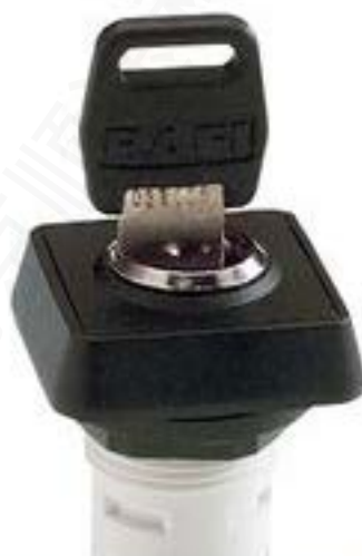
RAFIX 16, MICROMECC 钥匙开关, 正方形卡圈. 2 x 90°. 声感的. 拔出位 置 0+1+2