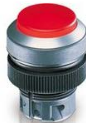
RAFIX 22 QR, 按键, 突起的灯罩, 圆形卡圈. 触感的. 前圈 绿色. 灯罩 红 色