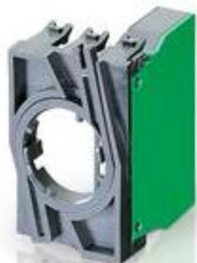
RAFIX 22 QR, 触点模块, 笼扣弹簧, 银触, 带连接器, 用于 BA9s, 1 关, 1 关