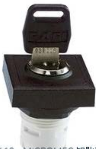
RAFIX 16, MICROMECC 钥匙开关, 可排列式正方形卡圈, 1 x 90°, L 形, 声感的, 拔出位置 0