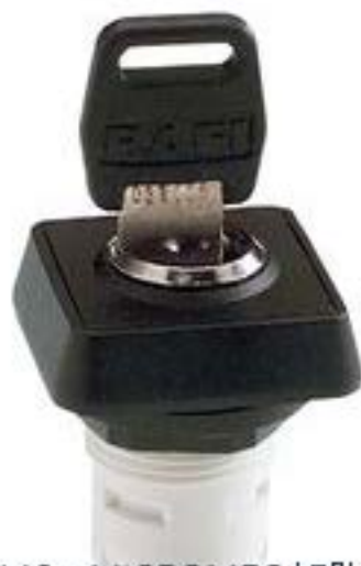
RAFIX 16, MICROMECC 钥匙开关, 正方形卡圈, 1 x 40°, 触感的. 拔出位 置 0