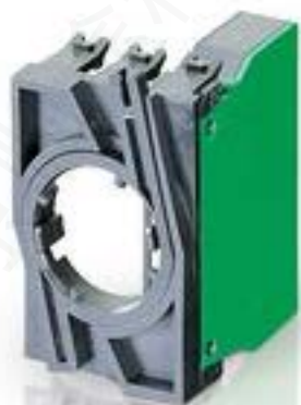
RAFIX 22 QR, 触点模块, 螺丝接口, 银触, 带连接器. 用于 BA9s, 2 开