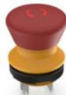
LUMOTAST 22, 急停按钮, 1 开 + 1 关, 银触, 快插端子 2.8 x .8, 镀锡, 复 位 通过旋转, 箭头 红色