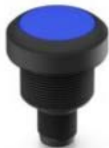
RAMO 22 I, M12, 圆形卡圈. 发光元件白色. 灯罩蓝色. M12 4-极 A-编码