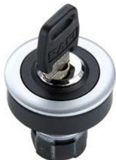
RAFIX 16 F, 钥匙开关, 圆形卡圈 1 x 90°, L形. 声感的