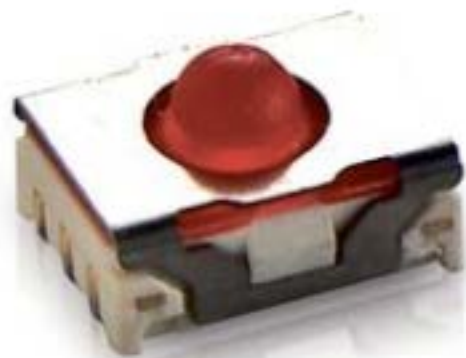
MICON 5, SMT 标准型, 2.9 N, 1 关