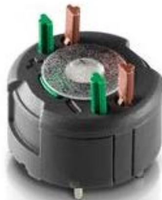
RAFIX FS 通用触点模块PCB, 金触. 用于 THT LED, 1 开