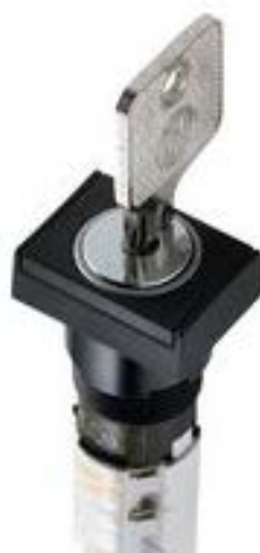
LUMOTAST 75 IP40, 钥匙开关, 方形卡圈, 1 开 + 1 关, 银触, 焊接端子, 90°, 声感的, 拔出位置 0