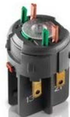
RAFIX FS QC通用触点模块, 金融, 光导体, 用于 LED-夹, 1开 + 1关