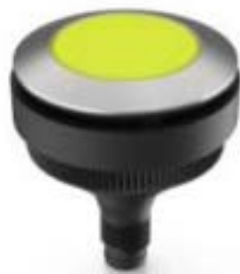
RAMO 30 T, M8, 圆形卡圈, 触感的, 前圈 不锈钢, 1 关, 灯罩 黄色