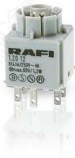
RAFIX 16, 标准触点模块, 金触, 无灯座, 快插端子, 2 开