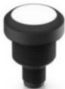
RAMO 22 I, M12, 圆形卡圈, 发光元件白色, 灯罩白色, M12 4-极 A-编码