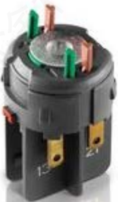
RAFIX FS 通用触点模块 QC, 银触, 1 关