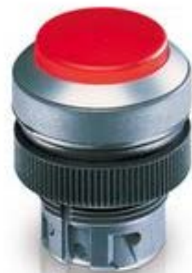
RAFIX 22 QR, 按键, 突起的灯罩, 圆形卡圈. 触感的. 前圈 黄色. 灯罩 红 色