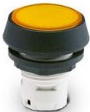
RAFIX 16, 按键, 平灯罩, 圆形卡圈 灯罩 红色