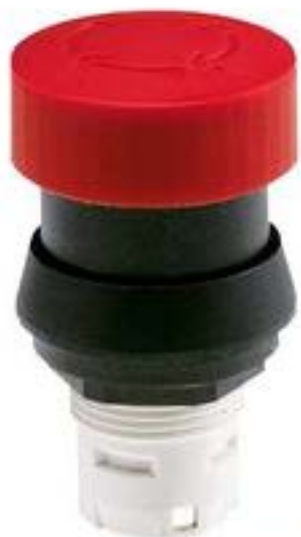
RAFIX 16, 急停, 圆形卡圈, 复位通过旋转