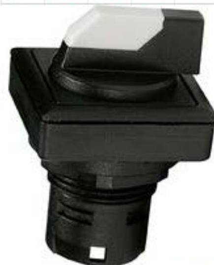
RAFIX 16 F, 选择开关, 正方形卡圈, 2 x 60°, 声感的