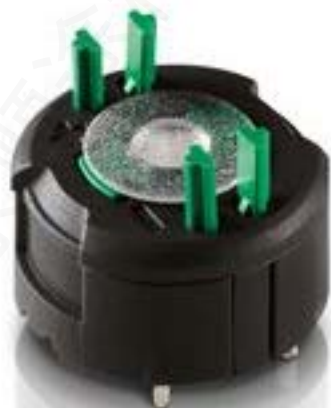
RAFIX FS 通用触点模块PCB, 银触, 用于 THT LED, 2 开