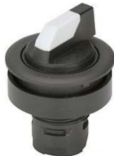
RAFIX 16 F, 选择开关, 圆形卡圈 1 x 40°, 触感的