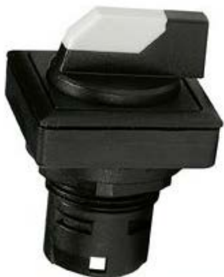
RAFIX 16 F, 选择开关, 正方形卡圈 1 x 90°, V形. 声感的