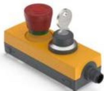
E-BOX M12, 急停, 钥匙开关, 金触, 复位 通过旋转