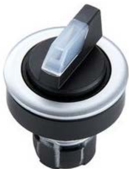
RAFIX 16 F, 选择开关, 圆形卡圈, 2 x 60°, 声感的