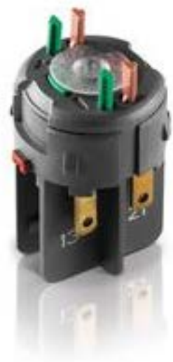
RAFIX FS QC通用触点模块, 银触, 光导体. 用于 LED-夹. 2开