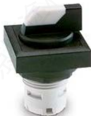
RAFIX 16, 发光选择开关, 可排列式正方形卡圈, 2 x 60°, 声感的