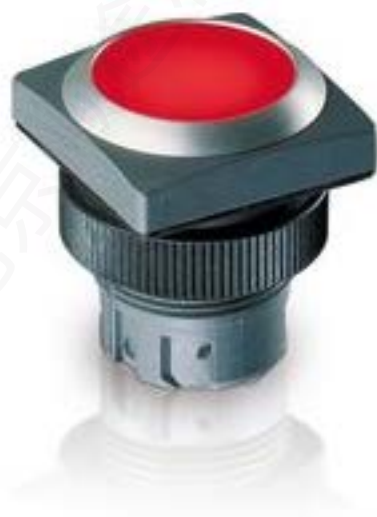
RAFIX 22 QR, 按键, 平灯罩, 正方形卡圈, 触感的, 前圈蓝色, 灯罩红色