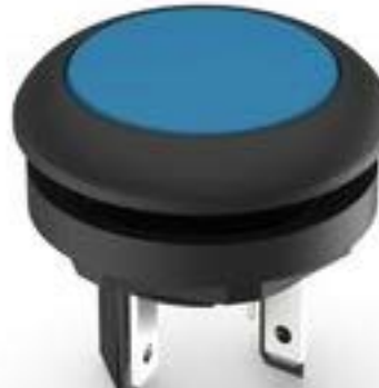
LUMOTAST 16, 按键, 圆形卡圈, 触感的, 前圈黑色, 1 关, 灯罩蓝色