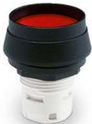
RAFIX 16, 发光按键, 突起的灯罩, 圆形卡圈 灯罩 黄色