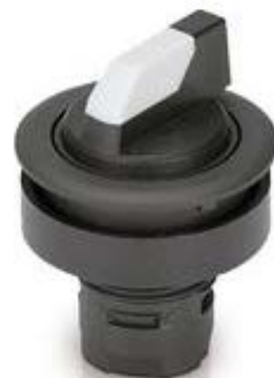
RAFIX 16 F, 发光选择开关, 圆形卡 圈, 2 x 40°, 触感的