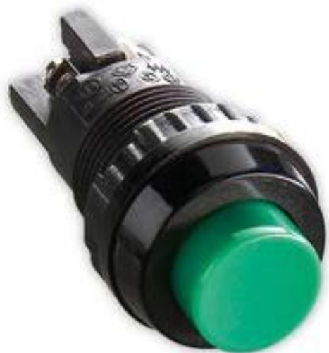
按键, 16.2 mm, 触感的, 1 关, 灯罩 黑色