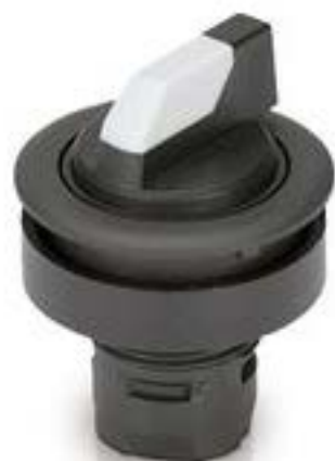
RAFIX 16 F, 发光选择开关, 圆形卡 圈, 1 x 90°, L形, 声感的