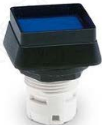
RAFIX 16, 发光按键, 突起的灯罩, 正方形卡圈 灯罩 黄色