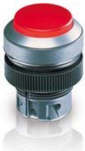
RAFIX 22 QR, 按键, 突起的灯罩, 圆形卡圈, 触感的. 前圈 蓝色, 灯罩 蓝 色