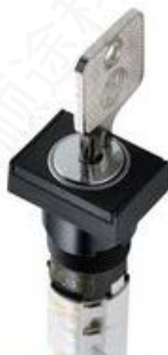
LUMOTAST 75 IP40, 钥匙开关, 方形卡圈, 2 开 + 2 关, 银触, 焊接端子, 90°, 声感的, 拔出位置 0+1