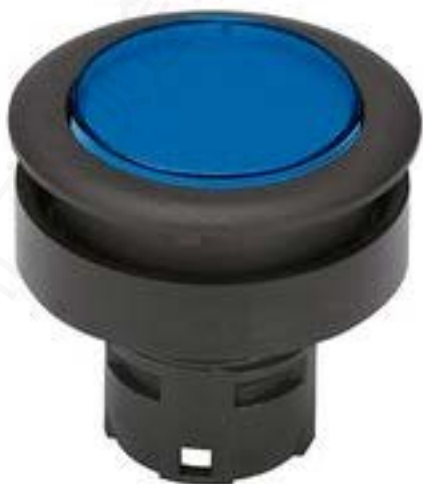
RAFIX 16 F, 发光按键, 平灯罩, 圆形卡圈 灯罩 蓝色