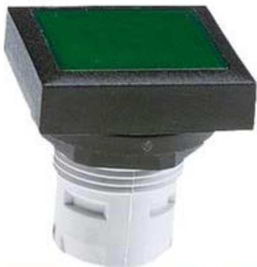
RAFIX 16, 发光按键, 平灯罩, 可排列式正方形卡圈. 灯罩 绿色