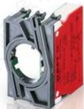
RAFIX 22 QR, 触点模块, 螺丝接口, 金触, 带连接器. 1 关, 1 关