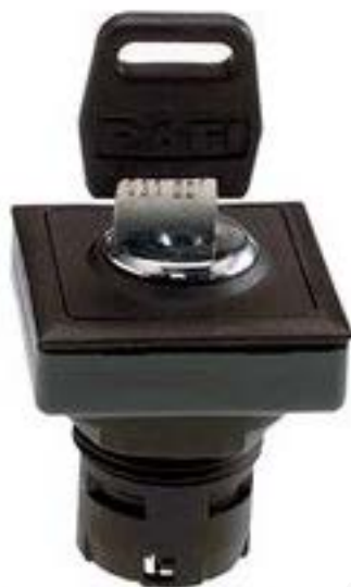
RAFIX 16 F, 钥匙开关, 正方形卡圈 2 x 40°, 触感的