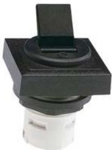
RAFIX 16, 扳钮开关, 可排列式正方形卡圈, 声感的