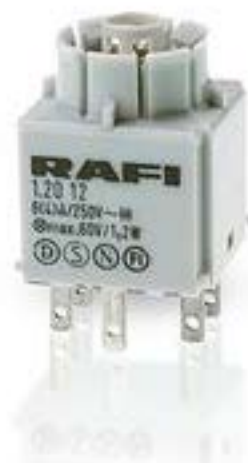
RAFIX 16, 标准触点模块, 金触, 带灯座, 快插端子. 用于 W 2 x 4.6d, 1 开 + 1 关