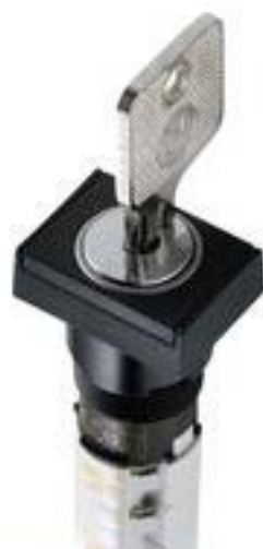
LUMOTAST 75 IP40, 钥匙开关, 方形卡圈, 1 开 + 1 关, 银触, 焊接端子, 90°, 声感的, 拔出位置 0+1