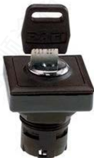
RAFIX 16 F, 钥匙开关, 正方形卡圈 1 x 90°, V形. 声感的