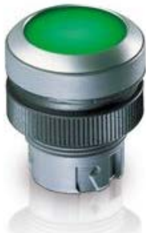
RAFIX 22 QR, 发光按键, 平灯罩, 圆形卡圈. 触感的. 前圈 银灰色. 灯罩 红色