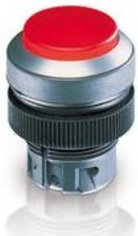
RAFIX 22 QR, 按键, 突起的灯罩, 圆形卡圈, 触感的, 前圈蓝色, 灯罩黑 色