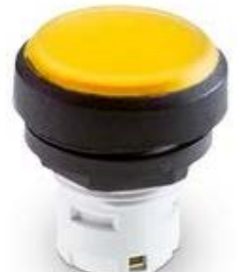
RAFIX 16, 发光按键, IP66, 灯罩 无 色