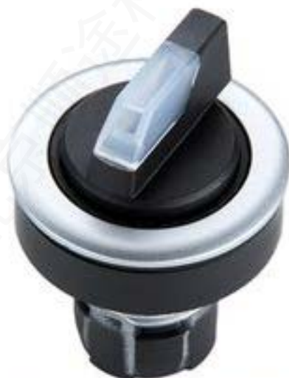
RAFIX 16 F, 选择开关, 圆形卡圈, 2 x 40°, 触感的