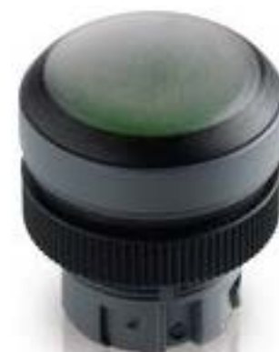
RAFIX 22 QR, 带防护罩的发光按钮, 平灯罩, 圆形卡圈. 触感的. 前圈 银灰色. 灯罩 蓝色