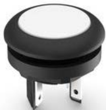
LUMOTAST 16, 发光按键, 圆形卡圈. 触感的. 前圈 黑色. 1 关. 灯罩 白色