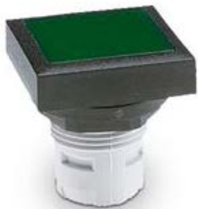
RAFIX 16, 发光按键, 平灯罩, 可排列式正方形卡圈. 灯罩 红色