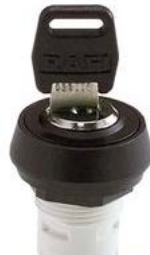
RAFIX 16, MICROMECC 钥匙开关, 圆形卡圈, 1 x 90°, L 形, 声感的, 拔 出位置 0