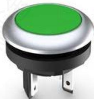
LUMOTAST 16, 按键, 圆形卡圈, 触感的, 前圈 银金属色, 1 关, 灯罩 绿色