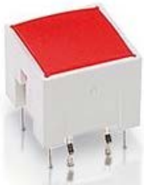
RACON 12 i, THT, 3.3 \pm 0.6 N, 灯罩 红色, 1 关