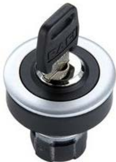
RAFIX 16 F, 钥匙开关, 圆形卡圈 1 x 90°, V形, 声感的