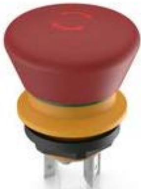
LUMOTAST 16, 急停按钮, 2 开 + 1 关, 银触, 快插端子 2.8 x .5, 镀锡, 复位通过旋转, 箭头 红色