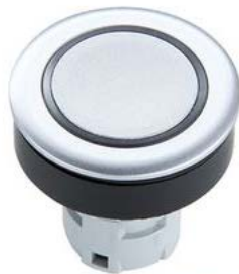
RAFIX 16 F, 发光按键, 平灯罩, 圆形卡圈, 灯罩 银灰色