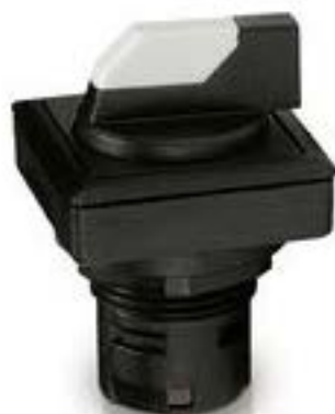
RAFIX 16 F, 发光选择开关, 正方形 卡圈, 2 x 40°, 触感的