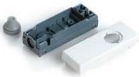
E-BOX 模块, 外壳, 250 V, 22.3 mm, 底面 M20, 浅灰色