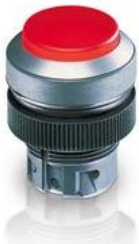
RAFIX 22 QR, 发光按键, 突起的灯罩, 圆形卡圈. 触感的前圈 红色. 灯罩 蓝色