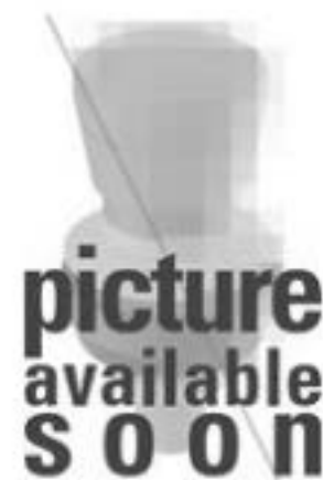
按键, 16.2 mm, 触感的, 1 关, 灯罩 绿色