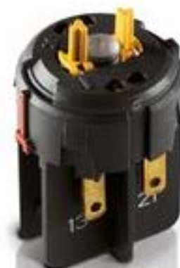
RAFIX FS QC急停触点模块, 银触, 光导体. 用于 LED-夹. 1 开