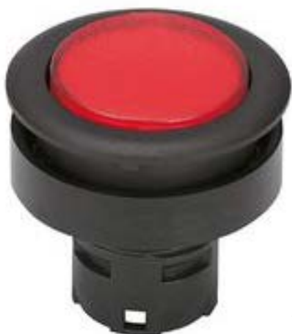
RAFIX 16 F, 发光按键, 平灯罩, 圆形卡圈 灯罩 红色