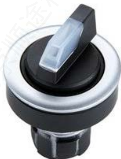
RAFIX 16 F, 选择开关, 圆形卡圈. 1 x 90°, V形. 声感的