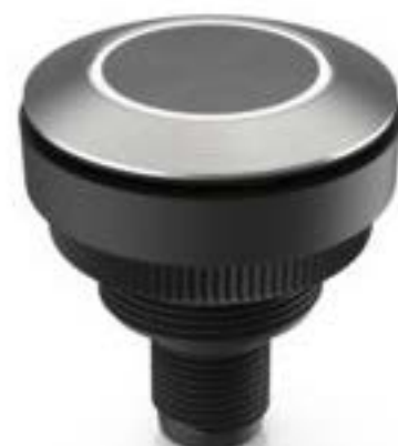
RAMO 30 T M12, 圆形卡圈, 环型照明, 触感的, 前圈 不锈钢, 颜色 透明, 1 关, 灯罩 不锈钢