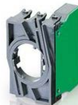
RAFIX 22 QR, 触点模块, 螺丝接口, 银触, 带连接器, 用于 BA9s, 1 开, 1 关