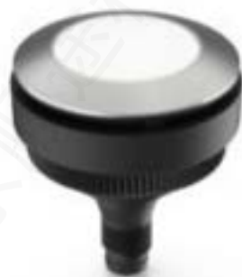
RAMO 30 T M8, 圆形卡圈, FLEXLAB, 触感的, 前圈 不锈钢, 1 关