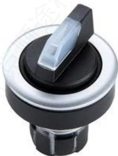
RAFIX 16 F, 选择开关, 圆形卡圈, 2 x 60°, 声感的