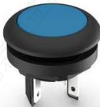
LUMOTAST 16, 发光按键, 圆形卡圈. 触感的. 前圈 黑色. 1 关. 灯罩 蓝色