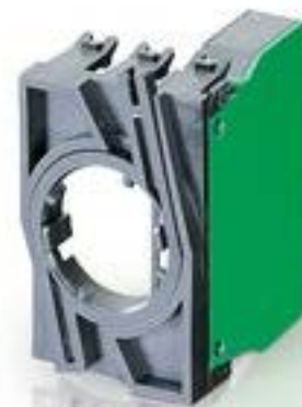
RAFIX 22 QR, 触点模块, 笼扣弹簧, 银触, 带连接器. 用于 BA9s. 1 开