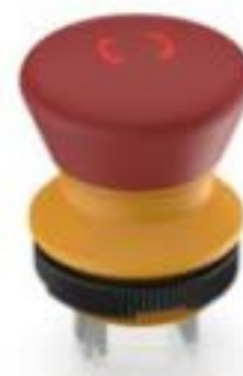
LUMOTAST 22, 急停按钮, 2 开, 银触, 快插端子 2.8 \times 8 , 镀锡, 复位通过旋转, 箭头 红色