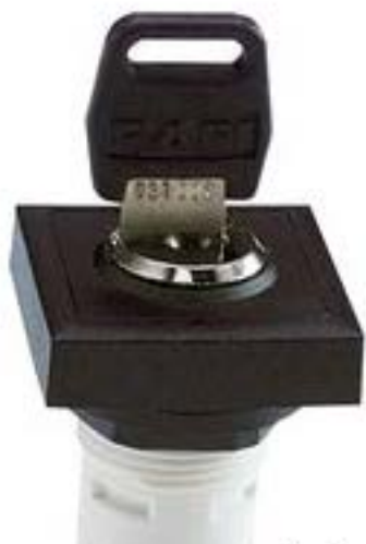
RAFIX 16, MICROMECC 钥匙开关, 可排列式正方形卡圈. 1 x 90°, V形. 声感的. 拔出位置 0+1