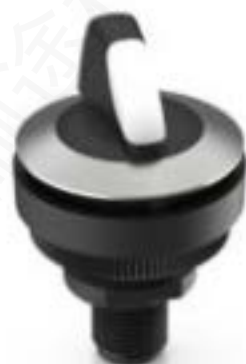
RAMO 30 S, M12, 圆形卡圈, 2 关, 金触, M12 8-极 A-编码, 前圈 不锈钢, 2 x 40°, 触感的