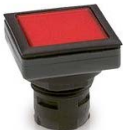
RAFIX 16 F, 发光按键, 平灯罩, 正方形卡圈. 灯罩 黄色