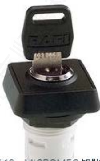
RAFIX 16, MICROMECC 钥匙开关, 正方形卡圈, 1 x 90°, L 形, 声感的, 拔出位置 0+1