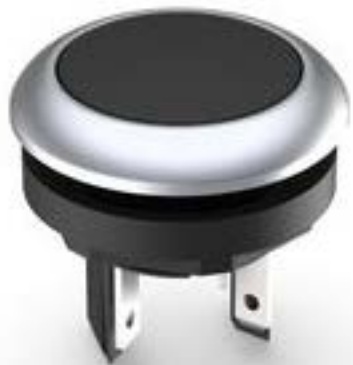
LUMOTAST 16, 按键, 圆形卡圈, 触感的, 前圈 银金属色, 1 关, 灯罩 黑色