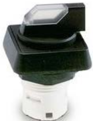
RAFIX 16, 发光选择开关, 正方形卡圈, 2 x 40°, 触感的