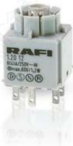
RAFIX 16, 标准触点模块, 银触, 无灯座, 快插端子. 2 关