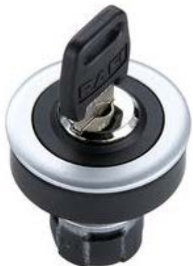
RAFIX 16 F, 钥匙开关, 圆形卡圈 2 x 40°, 触感的