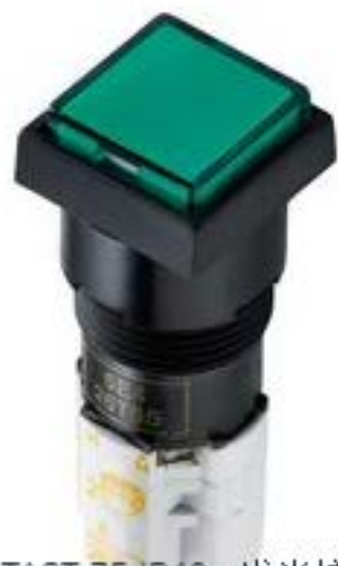
LUMOTAST 75 IP40, 发光按键, 正方形卡圈, 突起的灯罩. 触感的. 1开 + 1关