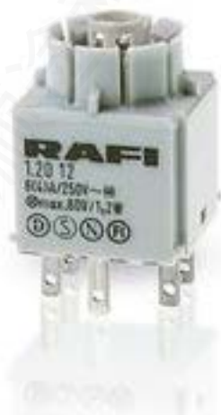
RAFIX 16, 通用触点模块, 银触, 无灯座, 快插端子. 2 开