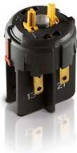
RAFIX FS QC急停触点模块, 金触, 光导体, 用于 LED-夹, 2 关