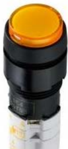
LUMOTAST 75 IP40, 发光按键, 圆形卡圈, 突起的灯罩, 声感的, 2 开 + 2 关