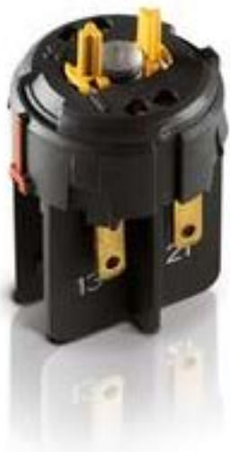
RAFIX FS 急停触点模块QC, 银触, 2 开