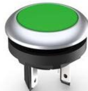
LUMOTAST 16, 发光按键, 圆形卡圈, 触感的, 前圈 银金属色, 1 关, 灯罩 绿色