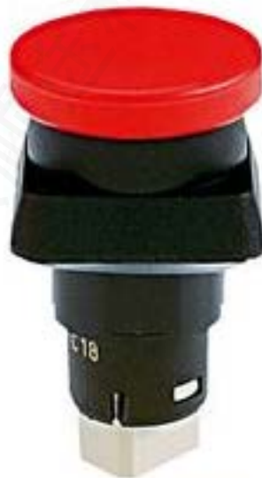
LUMOTAST 25, 急停按钮, 2 开, 金触, 端子连接板/插座, 复位 通过牵拉