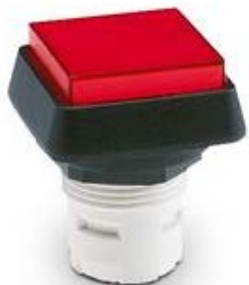
RAFIX 16, 按键, 突起的灯罩, 正方形卡圈. 灯罩 红色