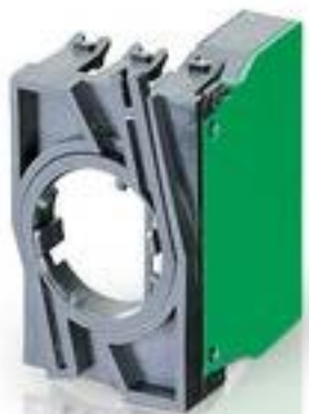
RAFIX 22 QR, 触点模块, 笼扣弹簧, 银触, 带连接器. 用于 BA9s. 1 关, 1 开