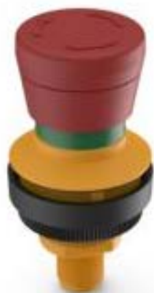
RAMO 30 E, M12, 圆形卡圈, 2 开, 金触, M12 5-极 A-编码, 复位通过旋转, 箭头 红色