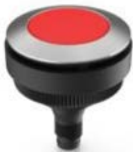
RAMO 30 T, M8, 圆形卡圈, 触感的, 前圈 不锈钢, 1 关, 灯罩 红色