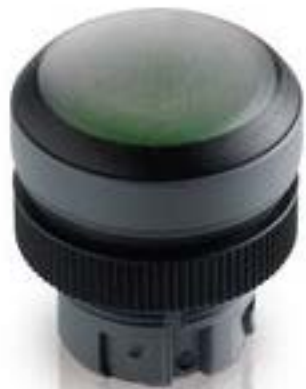
RAFIX 22 QR, 带防护罩的按键, 平 灯罩, 圆形卡圈. 触感的. 前圈 银灰 色. 灯罩 黑色