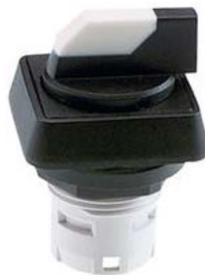
RAFIX 16, 选择开关, 正方形卡圈, 2 x 60°, 声感的