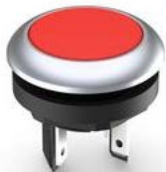
LUMOTAST 16, 发光按键, 圆形卡圈, 触感的, 前圈 银金属色, 1 关, 灯罩 红色