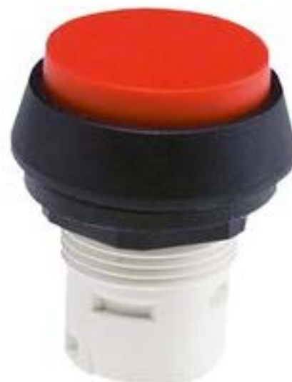
RAFIX 16, 按键, 突起的灯罩, 圆形卡圈. 灯罩 红色