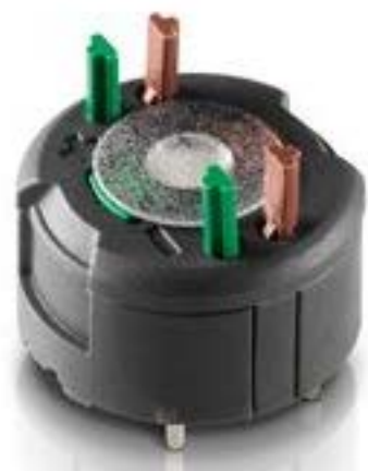
RAFIX FS 通用触点模块PCB, 金触, 用于 SMT LED, 2 开