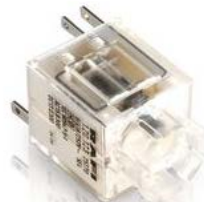
RAFIX 16, 通用触点模块, 金触, 带连接器监控, 快插端子, 2 开 + 1 关