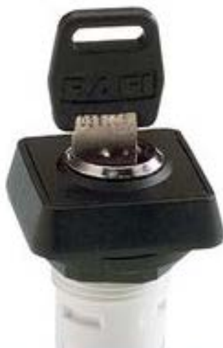
RAFIX 16, MICROMECC 钥匙开关, 正方形卡圈, 1 x 90°, L 形, 声感的, 拔出位置 0