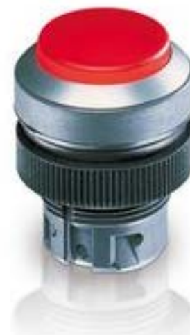
RAFIX 22 QR, 发光按键, 突起的灯罩, 圆形卡圈. 触感的前圈 绿色. 灯罩 蓝色