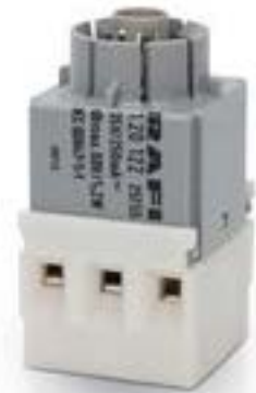
RAFIX 16, 通用触点模块, 金触, 带灯座, 螺丝接口. 用于 W 2 x 4.6d, 1 开 + 1 关