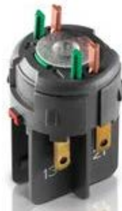
RAFIX FS 通用触点模块 QC, 银触, 1 开