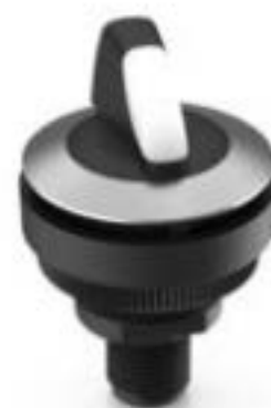
RAMO 30 S, M12, 圆形卡圈. 2 关. 金触. M12 4-极 A-编码. 前圈 不锈钢. 1 x 40°. 触感的