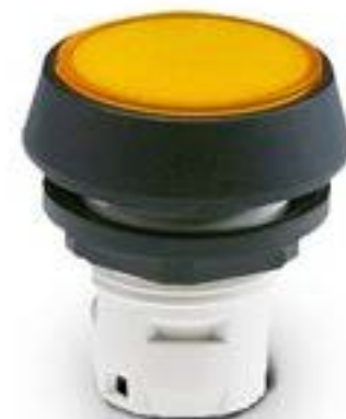
RAFIX 16, 按键, 平灯罩, 圆形卡 圈. 灯罩 黑色