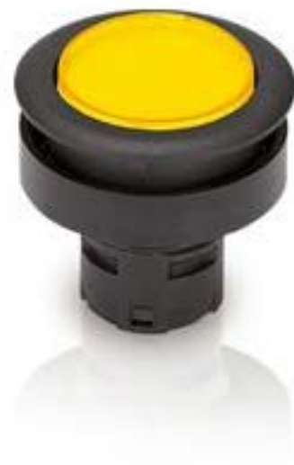
RAFIX 16 F, 发光按键, 平灯罩, 圆形卡圈 灯罩 无色