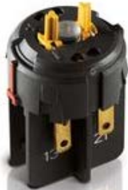
RAFIX FS QC急停触点模块, 金触, 光导体. 用于 LED-夹. 1 开