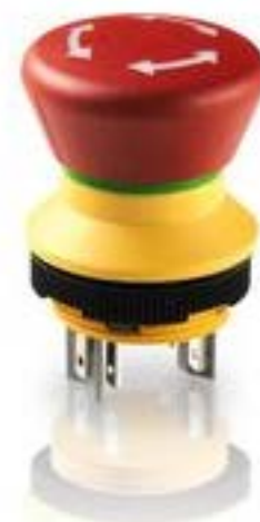
LUMOTAST 22, 急停按钮, 2 开 + 1 关, 银触, 快插端子 2.8 x .8, 镀锡, 复 位 通过旋转, 箭头 白色