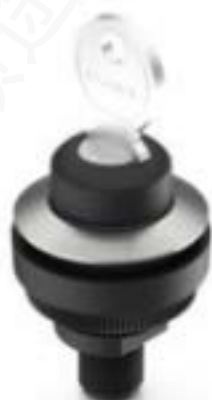
RAMO 30 K, M12, 圆形卡圈, 2 关, 金触, M12 4-极 A-编码, 前圈 不锈钢, 2 x 90°, 声感的, 拔出位置 0