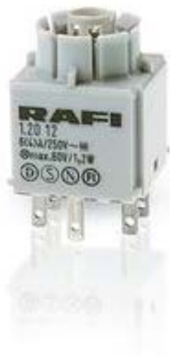
RAFIX 16, 标准触点模块, 银触, 无灯座, 快插端子, 2 关