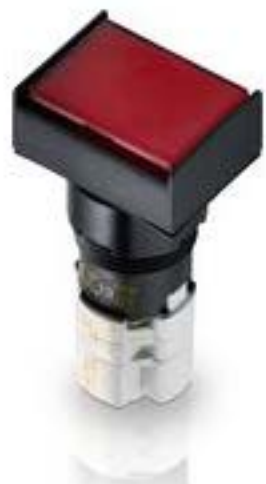
LUMOTAST 75 IP65, 发光按键, 方形卡圈, 平灯罩. 声感的. 2开 + 2关