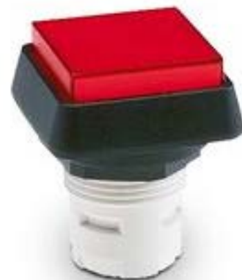
RAFIX 16, 按键, 突起的灯罩, 正方形卡圈 灯罩 黑色