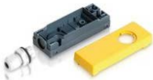
E-BOX 模块, 外壳, 35 V, 22.3 mm, 侧面 M16, 黄色