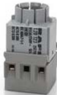
RAFIX 16, 通用触点模块, 银触, 带灯座, 螺丝接口. 用于 W 2 x 4.6d, 2 关