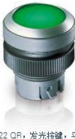
RAFIX 22 QR, 发光按键, 平灯罩, 圆形卡圈, 触感的, 前圈黑色, 灯罩白 色