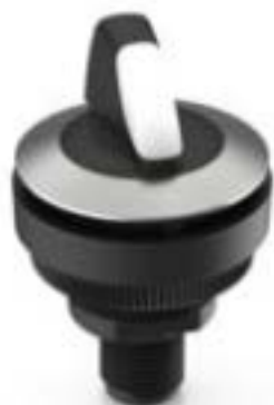
RAMO 30 S, M12, 圆形卡圈, 2 关, 金触, M12 4-极 A-编码, 前圈 不锈钢, 2 x 40°, 触感的