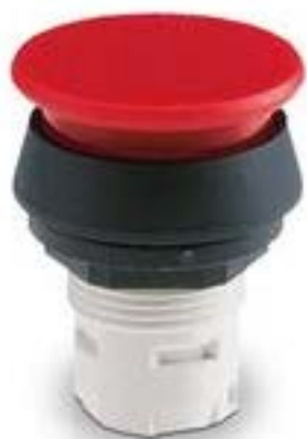
RAFIX 16 蘑菇头按钮, 圆形卡圈