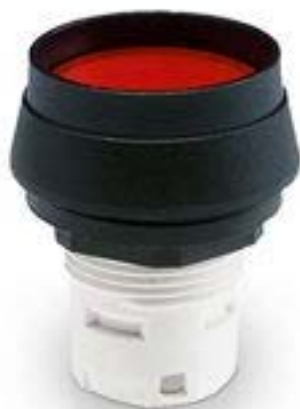
RAFIX 16, 发光按键, 突起的灯罩, 圆形卡圈 灯罩 无色