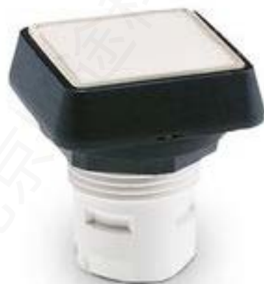
RAFIX 16, 按键, 平灯罩, 正方形卡 圈. 灯罩 蓝色