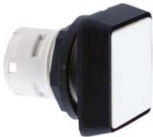
RAFIX 16, 按键, 平灯罩, 正方形卡 圈. 灯罩 白色