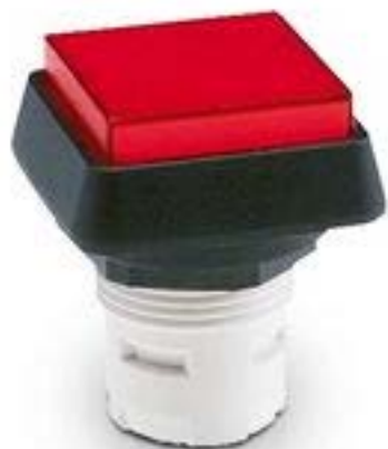
RAFIX 16, 发光按键, 突起的灯罩, 正方形卡圈 灯罩 黄色