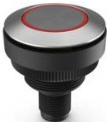
RAMO 30 T M12, 圆形卡圈, 环型 照明. 触感的. 前圈 不锈钢. 颜色 红 色. 1 关. 灯罩 不锈钢