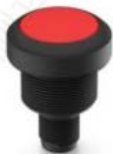
RAMO 22 I, M12, 圆形卡圈, 发光元件白色, 灯罩红色, M12 4-极 A-编码