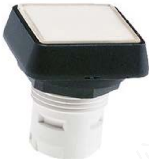
RAFIX 16, 发光按键, 平灯罩, 正方形卡圈, 灯罩 无色