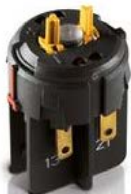
RAFIX FS QC急停触点模块, 银触, 光导体. 用于 LED-夹. 1 关