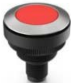
RAMO 30 T M12, 圆形卡圈, 触感的, 前圈 不锈钢, 1 关, 灯罩 红色