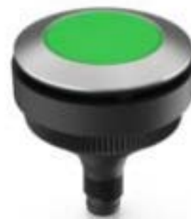
RAMO 30 T, M8, 圆形卡圈, 触感的, 前圈 不锈钢, 1 关, 灯罩 绿色