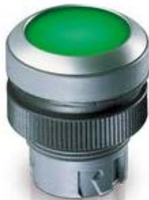
RAFIX 22 QR, 发光按键, 平灯罩, 圆形卡圈. 声感的. 前圈 银金属色. 灯 罩 红色