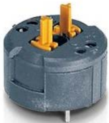
RAFIX FS 急停触点模块PCB，金触， 用于 SMT LED, 2 关