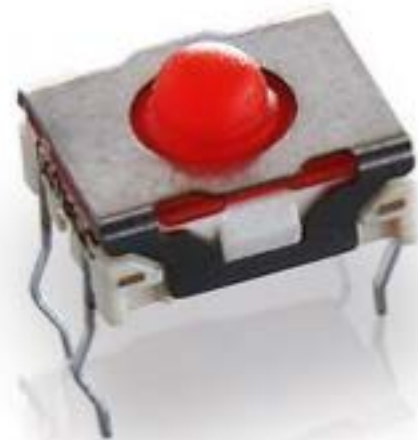
MICON 5, THT 标准型, 8 N, 1 关