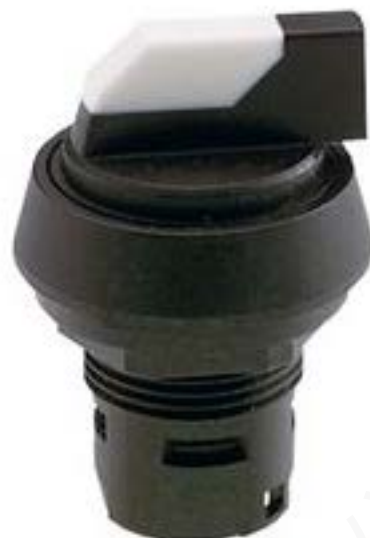
RAFIX 16, 选择开关, 圆形卡圈, 2 x 40°, 触感的