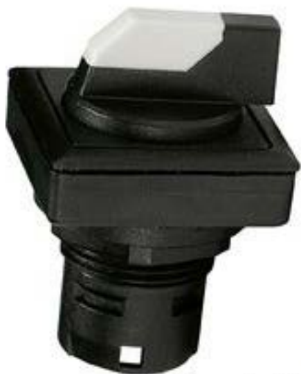
RAFIX 16 F, 选择开关, 正方形卡圈 1 x 40°, 触感的