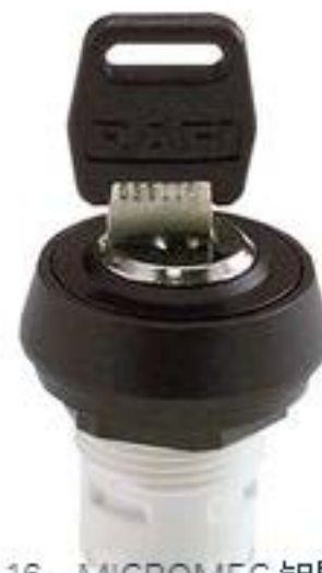
RAFIX 16, MICROMECC 钥匙开关, 圆形卡圈. 1 x 90°, V 形. 声感的. 拔 出位置 0