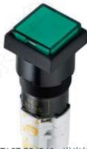
LUMOTAST 75 IP40, 发光按键, 正方形卡圈, 突起的灯罩. 触感的. 2开 + 2关