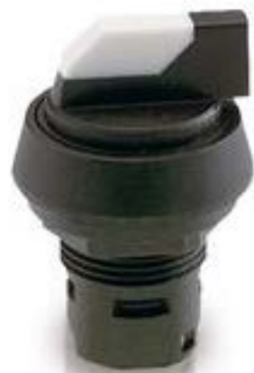
RAFIX 16, 发光选择开关, 圆形卡圈, 1 x 90°, V形, 声感的