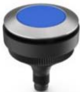
RAMO 30 T, M8, 圆形卡圈, 触感的, 前圈 不锈钢, 1 关, 灯罩 蓝色