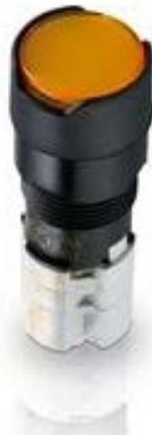
LUMOTAST 75 IP65, 发光按键, 圆形卡圈, 平灯罩, 声感的, 1 开 + 1 关