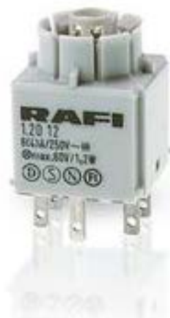
RAFIX 16, 通用触点模块, 银触, 无灯座, 快插端子. 2 关