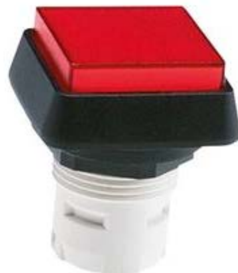
RAFIX 16, 发光按键, 突起的灯罩, 正方形卡圈 灯罩 红色