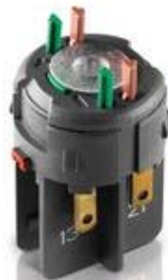
RAFIX FS QC通用触点模块, 金融, 光导体, 用于 LED-夹, 1开