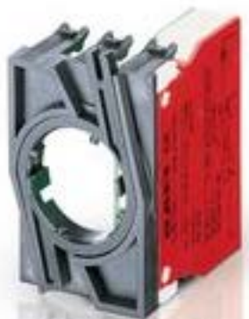
RAFIX 22 QR, 触点模块, 螺丝接口, 金触, 带连接器. 1 开, 1 开