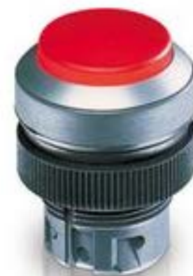
RAFIX 22 QR, 按键, 突起的灯罩, 圆形卡圈. 触感的. 前圈 银灰色. 灯罩 红色