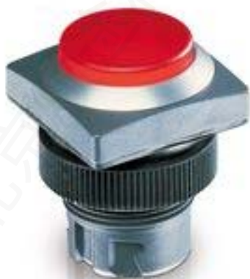
RAFIX 22 QR, 发光按键, 突起的灯罩, 正方形卡圈. 声感的. 前圈 红色. 灯罩 红色