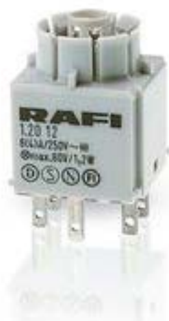
RAFIX 16, 通用触点模块, 金触, 无灯座, 快插端子, 1 开 + 1 关