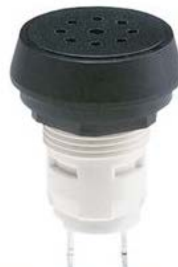
RAFIX 16, 声控信号传感器, 圆形卡圈, 70 dB