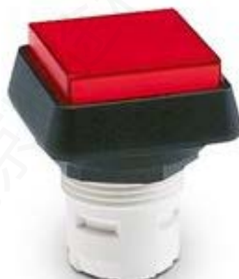
RAFIX 16, 发光按键, 突起的灯罩, 正方形卡圈 灯罩 无色