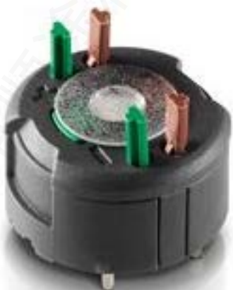
RAFIX FS 通用触点模块PCB, 金触. 用于 THT LED, 1 关