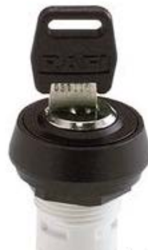
RAFIX 16, MICROMECC 钥匙开关, 圆形卡圈. 2 x 90°. 声感的. 拔出位置 0