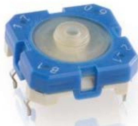
RACON 12, THT在内, 3.6 \pm 0.7 N, 1 关