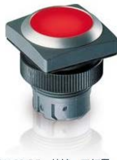
RAFIX 22 QR, 按键, 平灯罩, 正方形卡圈, 触感的, 前圈石板灰色, 灯罩红色