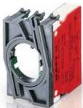
RAFIX 22 QR, 触点模块, 笼扣弹簧, 金触, 带连接器. 用于 BA9s, 1 开