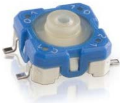
RACON 8, SMT, 3.3 \pm 0.6 N, 1 关