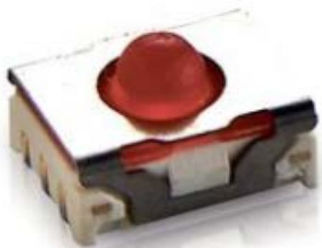
MICON 5, SMT 标准型, 1.5 N, 1 关