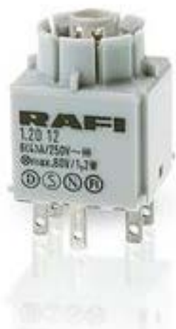
RAFIX 16, 标准触点模块, 银触, 带灯座, 快插端子. 用于 W 2 x 4.6d, 2 开