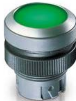
RAFIX 22 QR, 发光按键, 平灯罩, 圆形卡圈. 声感的. 前圈 银金属色. 灯 罩 黄色