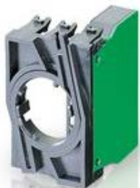
RAFIX 22 QR, 触点模块, 螺丝接口, 银触, 带连接器. 用于 BA9s, 1 关, 1 关