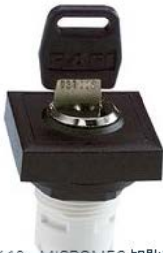
RAFIX 16, MICROMECH 钥匙开关, 可排列式正方形卡圈, 2 x 40°, 触感的, 拔出位置 0