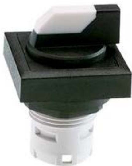
RAFIX 16, 选择开关, 可排列式正方形卡圈, 2 x 40°, 触感的