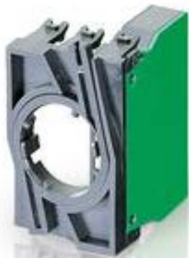
RAFIX 22 QR, 触点模块, 笼扣弹簧, 银触, 带连接器. 用于 BA9s. 1 关