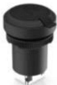
RAMO 22 F, RJ45, 圆形卡圈. 前圈黑色. RJ 45 CAT 5