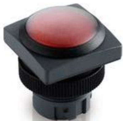
RAFIX 22 QR, 带防护罩的发光按键, 平灯罩, 正方形卡圈. 触感的. 前圈 银灰色. 灯罩 蓝色