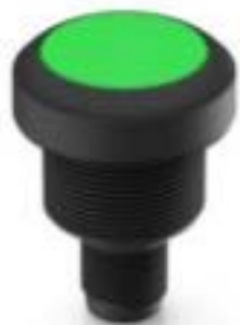
RAMO 22 I, M12, 圆形卡圈. 发光元件白色. 灯罩绿色. M12 4-极 A-编码