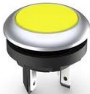
LUMOTAST 16, 发光按键, 圆形卡圈, 触感的, 前圈 银金属色, 灯罩 黄色