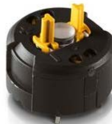
RAFIX FS 急停触点模块PCB, 银触, 用于 THT LED, 1 关