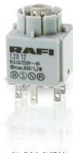
RAFIX 16, 标准触点模块, 银触, 带灯座, 快插端子, 用于 W 2 x 4.6d, 1 开 + 1 关