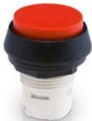
RAFIX 16, 按键, 突起的灯罩, 圆形卡圈. 灯罩 黑色