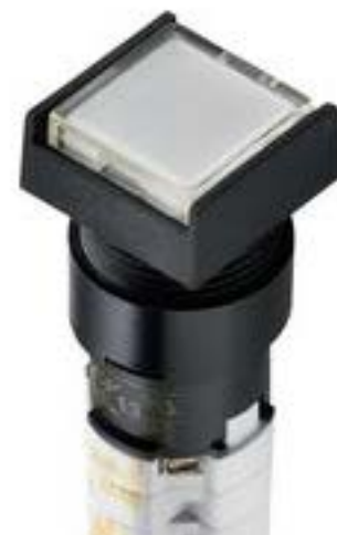
LUMOTAST 75 IP40, 发光按键, 正方形卡圈, 平灯罩. 触感的. 2开 + 2关