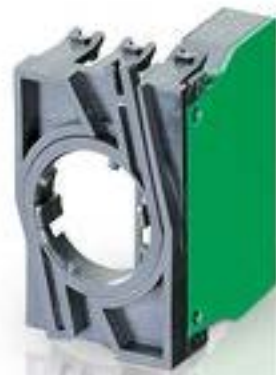
RAFIX 22 QR, 触点模块, 螺丝接口, 银触, 带连接器.用于 BA9s, 2 开