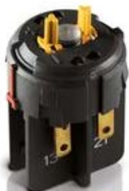
RAFIX FS 急停触点模块QC, 银触. 1 开