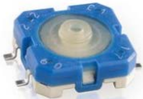
RACON 12, SMT, 3,6 \pm 0,7 N, 1 关