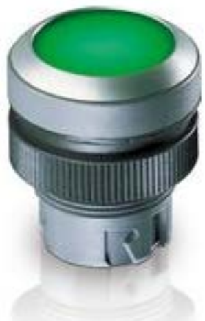
RAFIX 22 QR, 发光按键, 平灯罩, 圆形卡圈. 触感的. 前圈 红色. 灯罩 黄 色