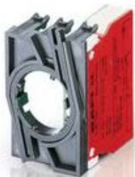
RAFIX 22 QR, 触点模块, 笼扣弹簧, 金触, 带连接器. 用于 BA9s, 1 关, 1 关