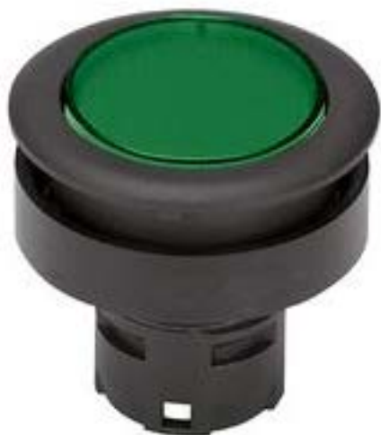
RAFIX 16 F, 发光按键, 平灯罩, 圆形卡圈 灯罩 绿色