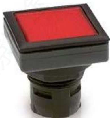
RAFIX 16 F, 按键, 平灯罩, 正方形 卡圈 灯罩 绿色