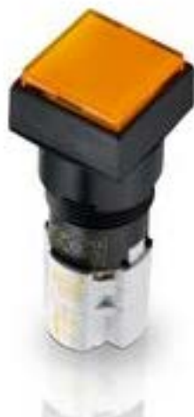
LUMOTAST 75 IP65, 发光按键, 正方形卡圈, 突起的灯罩. 声感的. 1开 + 1关