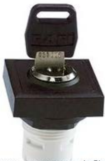
RAFIX 16, MICROMECC 钥匙开关, 可排列式正方形卡圈, 1 x 40°, 触感 的. 拔出位置 0