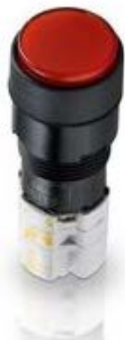
LUMOTAST 75 IP65, 发光按键, 圆形卡圈, 突起的灯罩. 触感的. 1 开 + 1 关