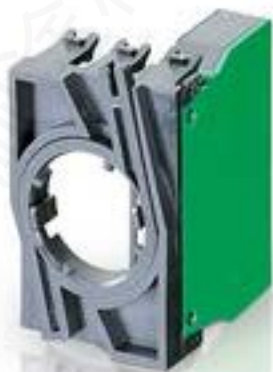
RAFIX 22 QR, 触点模块, 笼扣弹簧, 银触, 带连接器. 用于 BA9s. 1 关 + 1 开