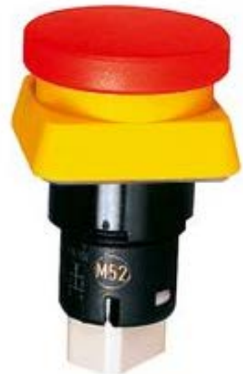
LUMOTAST 25, 急停按钮, 2 开, 金触, 端子连接板/插座, 复位 通过牵拉