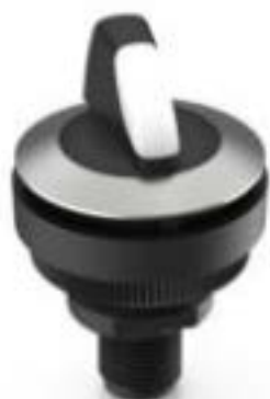
RAMO 30 S, M12, 圆形卡圈, 2 关, 金触, M12 4-极 A-编码, 前圈 不锈钢, 1 x 90°, 1 x 40°, 触感的/声感的