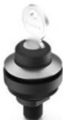
RAMO 30 K, M12, 圆形卡圈, 2 关, 金触, M12 4-极 A-编码, 前圈 不锈钢, 1 x 90°, L 形, 声感的, 拔出位置 0