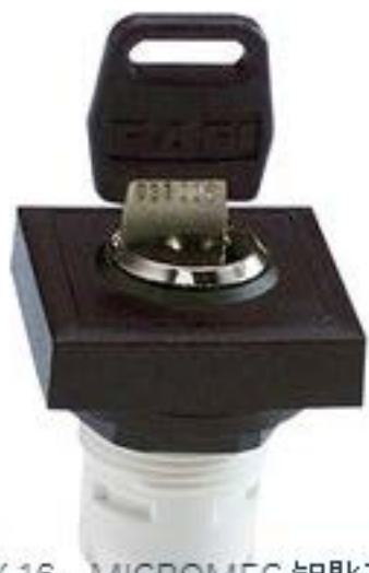
RAFIX 16, MICROMECC 钥匙开关, 可排列式正方形卡圈. 1 x 90°, L 形. 声感的. 拔出位置 0+1