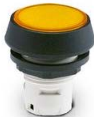
RAFIX 16, 按键, 平灯罩, 圆形卡圈 灯罩 黄色