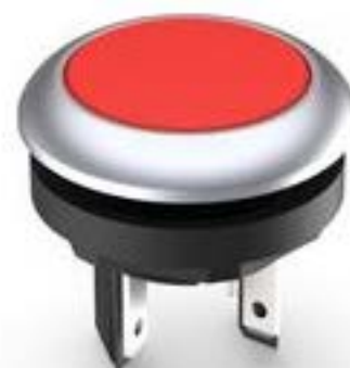
LUMOTAST 16, 按键, 圆形卡圈, 触感的, 前圈 银金属色, 1 关, 灯罩 红色