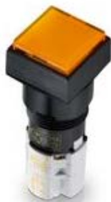
LUMOTAST 75 IP65, 发光按键, 正方形卡圈, 突起的灯罩. 触感的. 1 开 + 1 关