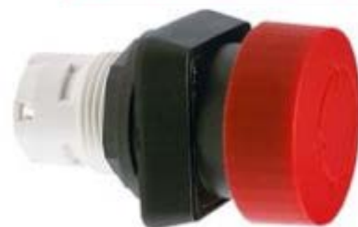
RAFIX 16, 急停, 正方形卡圈, 复位通过旋转