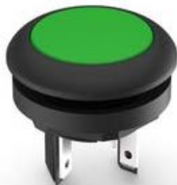
LUMOTAST 16, 发光按键, 圆形卡圈. 触感的. 前圈 黑色. 1 关. 灯罩 绿色