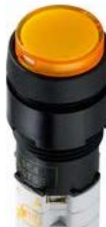
LUMOTAST 75 IP40, 发光按键, 圆形卡圈, 突起的灯罩. 触感的. 1开 + 1关