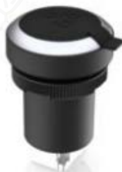
RAMO 22 F, RJ45, 圆形卡圈. 前圈银金属色. RJ 45 CAT 5