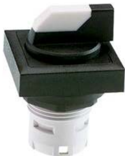
RAFIX 16, 选择开关, 可排列式正方形卡圈, 2 x 60°, 声感的