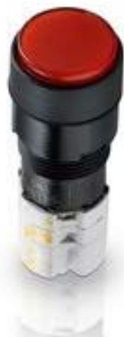
LUMOTAST 75 IP65, 发光按键, 圆形卡圈, 突起的灯罩. 触感的. 2 开 + 2 关