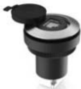
RAMO 30 F, RJ45, 圆形卡圈, 前圈 不锈钢, RJ 45 CAT 5