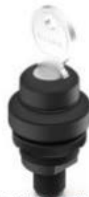
RAMO 22 K, M12, 圆形卡圈, 1 开 + 1 关, 金触, M12 4-极 A-编码, 前圈黑色, 1 x 90°, V 形, 声感的, 拔出位置 0+1