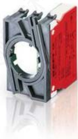
RAFIX 22 QR, 触点模块, 螺丝接口, 金触, 带连接器, 用于 BA9s, 1 关