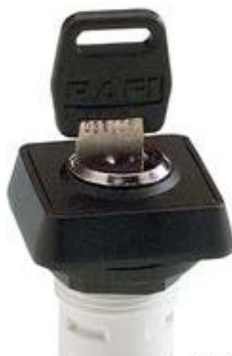
RAFIX 16, MICROMECC 钥匙开关, 正方形卡圈. 2 x 90°. 声感的. 拔出位 置 0