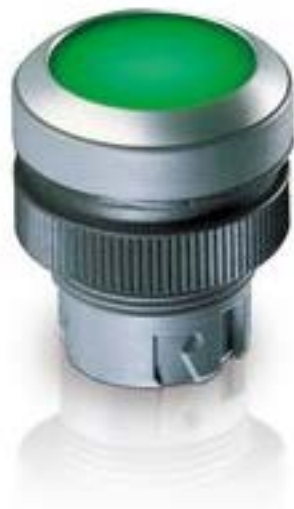
RAFIX 22 QR, 按键, 平灯罩, 圆形卡圈, 声感的, 前圈绿色, 灯罩黄色