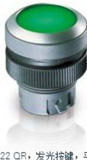
RAFIX 22 QR, 发光按键, 平灯罩, 圆形卡圈, 触感的, 前圈石板灰色, 灯 罩白色