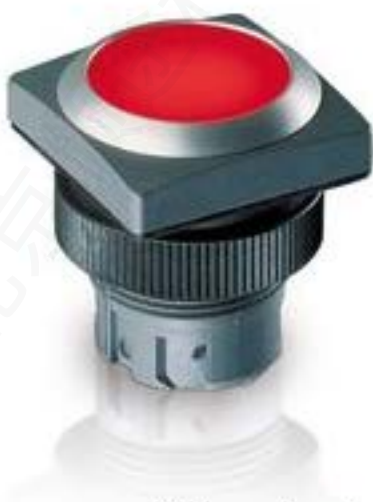
RAFIX 22 QR, 按键, 平灯罩, 正方形卡圈, 声感的, 前圈银灰色, 灯罩红色