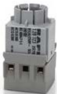
RAFIX 16, 通用触点模块, 银触, 无灯座, 螺丝接口, 2 关