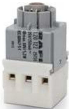
RAFIX 16, 通用触点模块, 金触, 带灯座, 螺丝接口. 用于 W 2 x 4.6d, 2 关