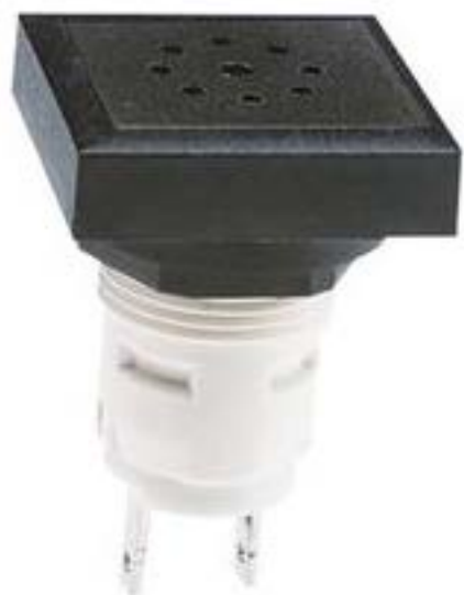
RAFIX 16, 声控信号传感器, 可排列式正方形卡圈. 70 dB