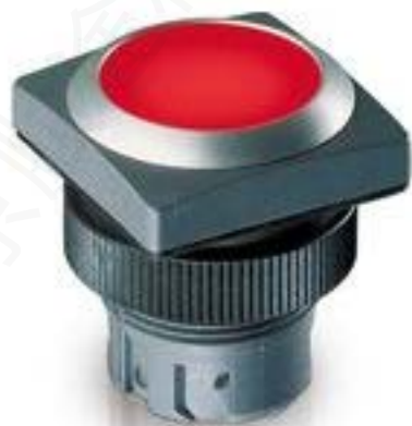
RAFIX 22 QR, 发光按键, 平灯罩, 正方形卡圈. 触感的. 前圈 银金属色. 灯罩 蓝色