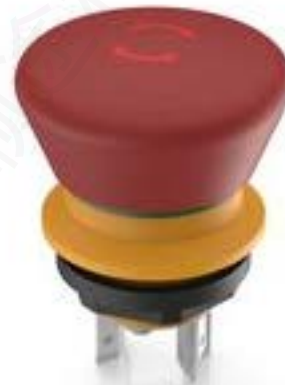
LUMOTAST 16, 急停按钮, 可发光, 2 开, 银触, 快插端子 2.8 x .5, 镀锡, 复位通过旋转, 箭头 红色