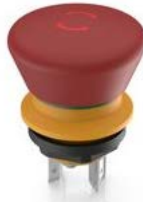
LUMOTAST 16, 急停按钮, 1 开, 银触, 快插端子 2.8 x .5, 镀锡, 复位通过旋转, 箭头 红色