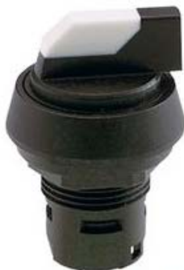
RAFIX 16, 选择开关, 圆形卡圈, 1 x 90°, V形, 声感的