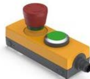
E-BOX M12, 急停, 发光按键, 金触, M12 8-极 A-编码, 复位 通过旋转