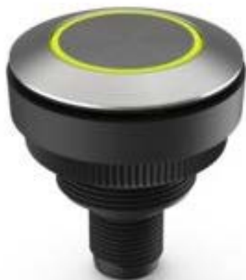
RAMO 30 T M12, 圆形卡圈, 环型 照明. 触感的. 前圈 不锈钢. 颜色 黄 色. 1 关. 灯罩 不锈钢