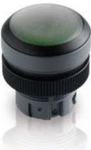
RAFIX 22 QR, 带防护罩的按键, 平灯罩, 圆形卡圈. 触感的. 前圈 黑色. 灯罩 白色