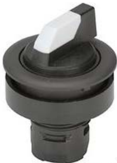
RAFIX 16 F, 选择开关, 圆形卡圈, 2 x 60°, 声感的