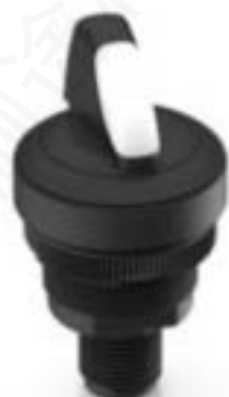
RAMO 22 S, M12, 圆形卡圈, 1 关, 金触, M12 4-极 A-编码, 前圈 黑色, 1 x 40°, 触感的