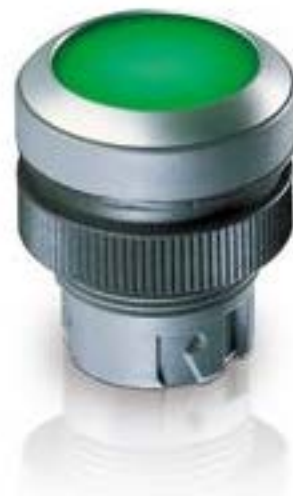
RAFIX 22 QR, 按键, 平灯罩, 圆形卡圈, 触感的, 前圈蓝色, 灯罩黑色