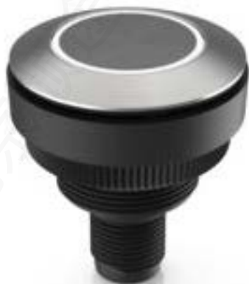
RAMO 30 T M12, 圆形卡圈, 冗余. 触感的. 前圈 不锈钢. 颜色 透明. 2 关. 灯罩 不锈钢