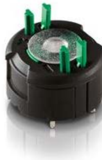
RAFIX FS 通用触点模块PCB, 银触, 用于 SMT LED, 1开