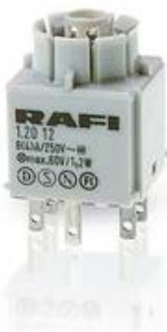
RAFIX 16, 标准触点模块, 金触, 带灯座, 快插端子. 用于 W 2 x 4.6d. 1 开 + 1 关