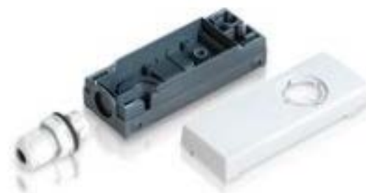
E-BOX 模块, 外壳, 250 V, 22.3 mm, 侧面 M16, 浅灰色