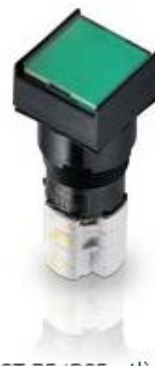
LUMOTAST 75 IP65, 发光按键, 正方形卡圈, 平灯罩. 触感的. 1开 + 1关