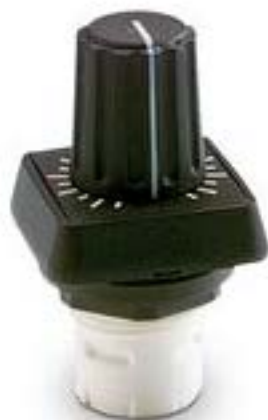
RAFIX 16, 变位器-传动装置, 正方形卡圈