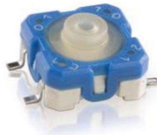
RACON 8, SMT, 4.8 \pm 0.8 N, 1 关