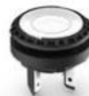
LUMOTAST 16, 发光按键, 圆形卡圈, C-LAB, 触感的, 1 关