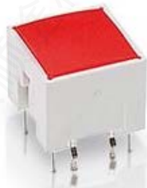
RACON 12 i, THT, 3,3 \pm 0,6 N, 灯罩 黄色, 1 关