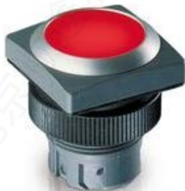
RAFIX 22 QR, 发光按键, 平灯罩, 正方形卡圈. 声感的. 前圈 银灰色. 灯 罩 红色