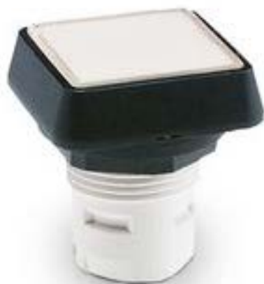
RAFIX 16, 按键, 平灯罩, 正方形卡 圈. 灯罩 绿色