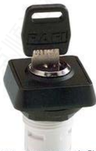
RAFIX 16, MICROMECC 钥匙开关, 正方形卡圈, 2 x 40°, 触感的. 拔出位 置 0