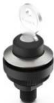
RAMO 30 K, M12, 圆形卡圈, 2 关, 金触, M12 4-极 A-编码, 前圈 不锈钢, 1 x 40°, 触感的, 拔出位置 0