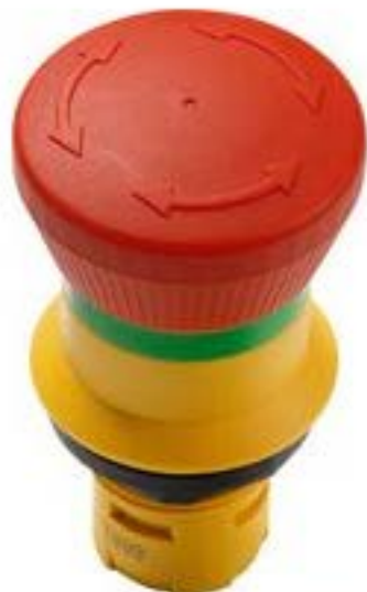
RAFIX 16, 急停, 圆形卡圈, 锥状, 复位通过旋转