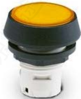
RAFIX 16, 发光按键, 平灯罩, 圆形 卡圈 灯罩 蓝色