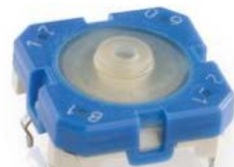
RACON 12, THT在内, 6.8 \pm 1.6 N, 1 关