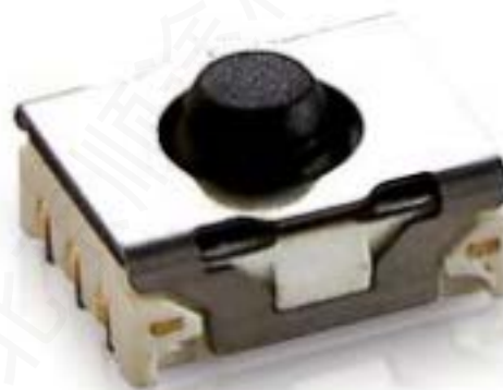
MICON 5, SMT在下方, 3 N, 1 关