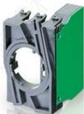
RAFIX 22 QR, 触点模块, 螺丝接口, 银触, 带连接器, 用于 BA9s, 1 关