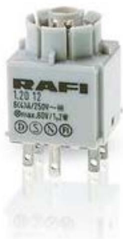
RAFIX 16, 标准触点模块, 银触, 带灯座, 快插端子. 用于 W 2 x 4.6d. 2 关