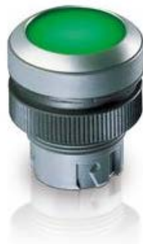
RAFIX 22 QR, 按键, 平灯罩, 圆形卡圈, 声感的, 前圈黑色, 灯罩绿色