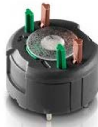
RAFIX FS 通用触点模块PCB, 金触, 用于 THT LED, 2 开