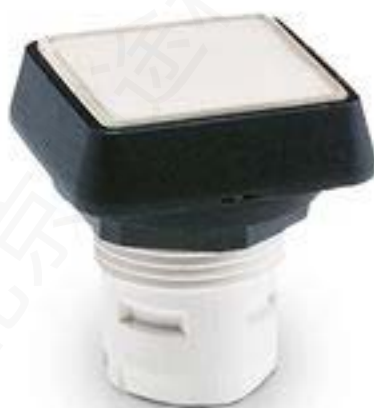
RAFIX 16, 发光按键, 平灯罩, 正方形卡圈, 灯罩 绿色