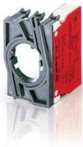
RAFIX 22 QR, 触点模块, 螺丝接口, 金触, 带连接器, 1 开 + 1 关