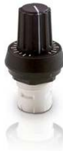
RAFIX 16, 变位器-传动装置, 圆形卡圈