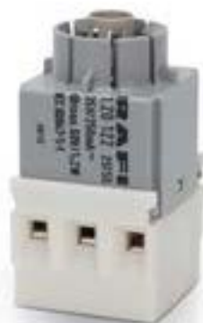
RAFIX 16, 通用触点模块, 金触, 无灯座, 螺丝接口, 2 关