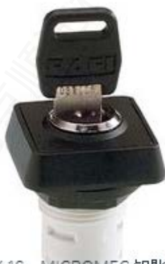
RAFIX 16, MICROMECC 钥匙开关, 正方形卡圈. 1 x 90°, V 形. 声感的. 拔出位置 0+1