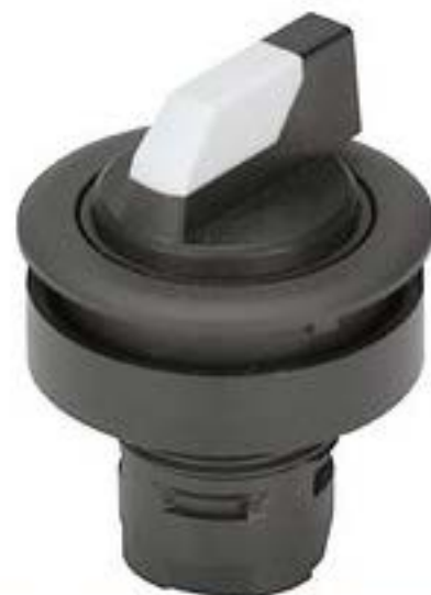
RAFIX 16 F, 选择开关, 圆形卡圈. 1 x 90°, V形. 声感的