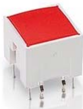
RACON 12i, THT, 3.3 \pm 0.6 N, 灯罩 红色, 1 关