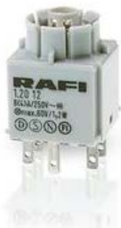
RAFIX 16, 通用触点模块, 金触, 带灯座, 快插端子. 用于 W 2 x 4.6d. 2 关