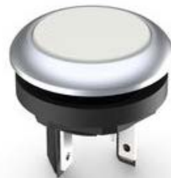
LUMOTAST 16, 发光按键, 圆形卡圈. 触感的. 前圈 银金属色. 1 关. 灯罩 白色