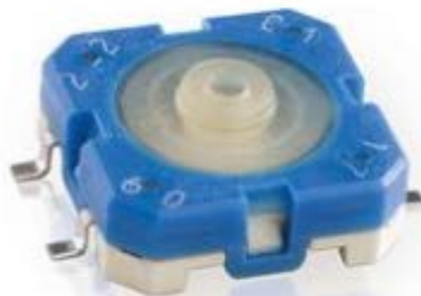
RACON 12, SMT, 6.8 \pm 1.6 N, 1 关