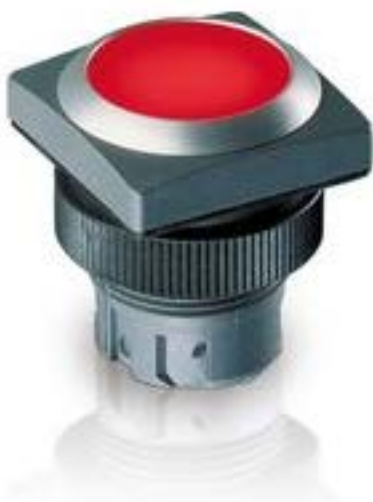
RAFIX 22 QR, 按键, 平灯罩, 正方形卡圈, 声感的, 前圈绿色, 灯罩红色