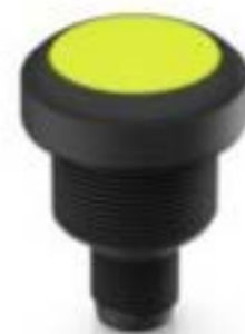
RAMO 22 I, M12, 圆形卡圈, 发光元件白色, 灯罩黄色, M12 4-极 A-编码