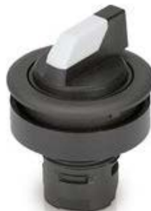
RAFIX 16 F, 发光选择开关, 圆形卡圈, 2 x 60°, 声感的