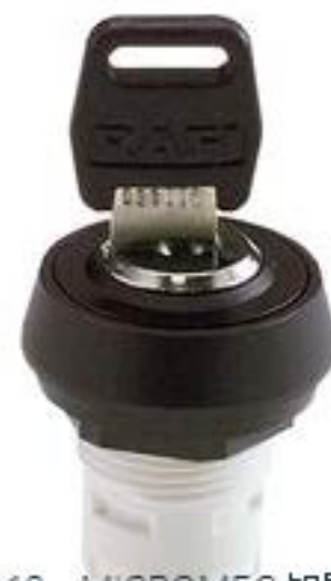
RAFIX 16, MICROMECC 钥匙开关, 圆形卡圈, 1 x 90°, L 形, 声感的, 拔 出位置 0+1