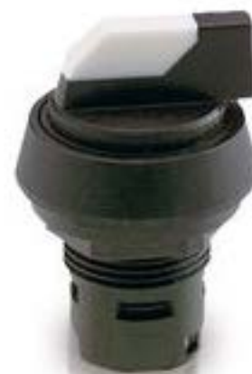
RAFIX 16, 发光选择开关, 圆形卡圈, 2 x 60°, 声感的