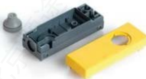
E-BOX 模块, 外壳, 35 V, 22.3 mm, 底面 M20, 黄色