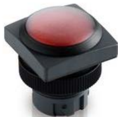
RAFIX 22 QR, 带防护罩的发光按 键, 平灯罩, 正方形卡圈. 触感的. 前 圈 黑色. 灯罩 白色