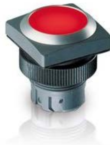
RAFIX 22 QR, 按键, 平灯罩, 正方形卡圈, 声感的, 前圈蓝色, 灯罩红色