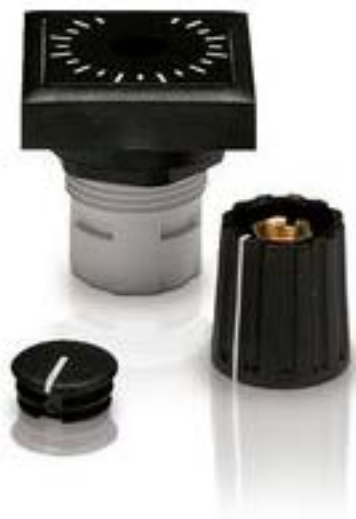
RAFIX 16, 变位器-传动装置, 可排列式正方形卡圈