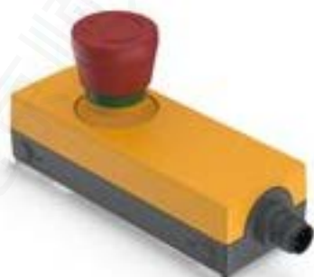
E-BOX M12, 急停, 金触, M12 4-极 A-编码, 复位 通过旋转