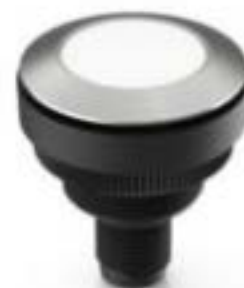
RAMO 30 T M12, 圆形卡圈, 触感的, 前圈 不锈钢, 1 关, 灯罩 白色