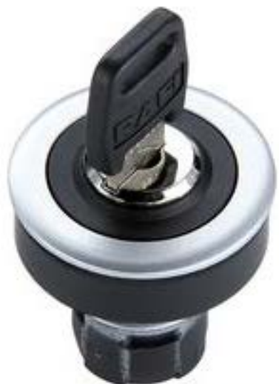
RAFIX 16 F, 钥匙开关, 圆形卡圈 1 x 40°, 触感的