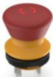
LUMOTAST 22, 急停按钮, 可发光, 2 开, 银触, 快插端子 2.8 x .8, 镀锡, 复位 通过旋转, 箭头 红色