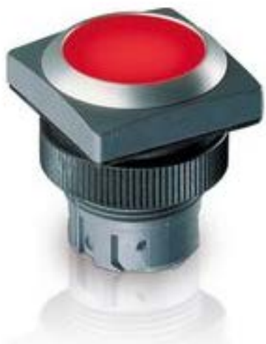
RAFIX 22 QR, 按键, 平灯罩, 正方形卡圈, 声感的, 前圈黄色, 灯罩蓝色