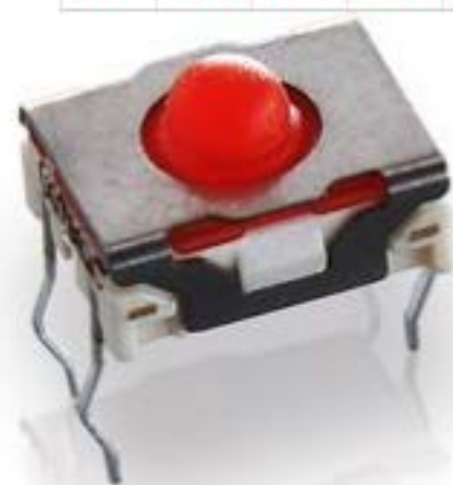
MICON 5, THT 标准型, 3 N, 1 关