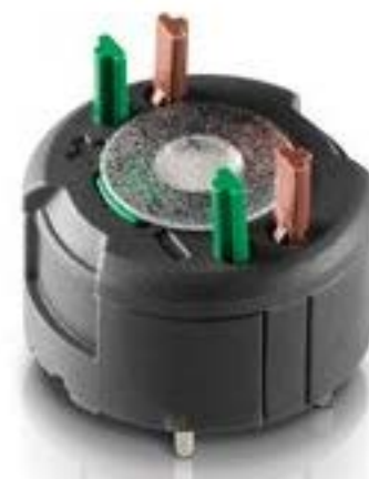
RAFIX FS 通用触点模块PCB, 金触, 用于 SMT LED, 2 关