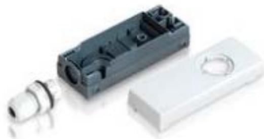
E-BOX 模块, 外壳, 35 V, 22.3 mm, 侧面 M16, 浅灰色