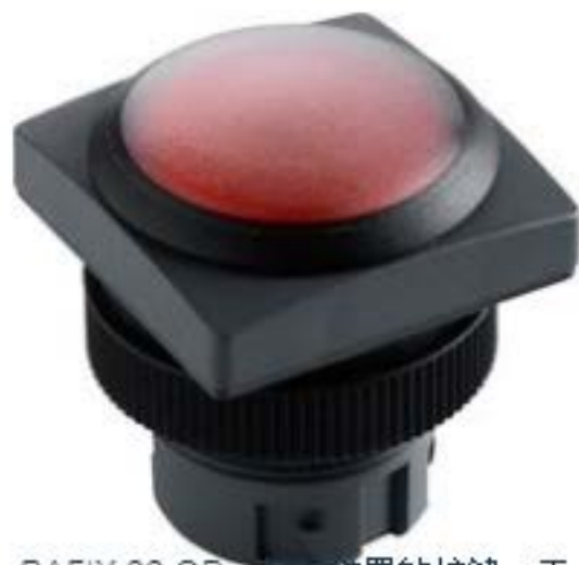
RAFIX 22 QR, 带防护罩的按键, 平灯罩, 正方形卡圈. 触感的. 前圈黑色. 灯罩红色