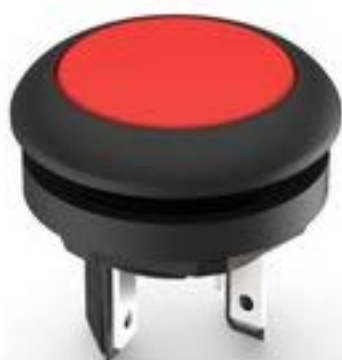
LUMOTAST 16, 发光按键, 圆形卡圈. 触感的. 前圈 黑色. 1 关. 灯罩 红色