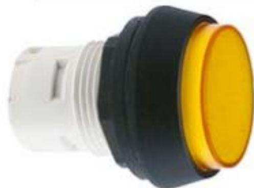
RAFIX 16, 发光按键, 突起的灯罩, 圆形卡圈 灯罩 黄色