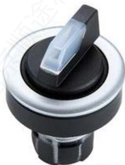
RAFIX 16 F, 选择开关, 圆形卡圈 1 x 40°, 触感的