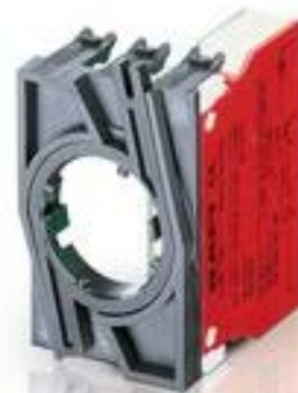
RAFIX 22 QR, 触点模块, 笼扣弹簧, 金触, 带连接器. 1 关 + 1 开