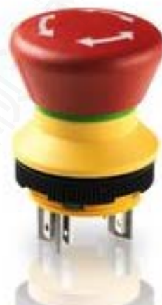
LUMOTAST 22, 急停按钮, 2 开, 银触, 快插端子 2.8 \times 8 , 镀锡, 复位通过旋转, 箭头 白色