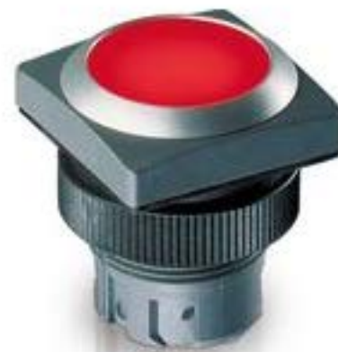
RAFIX 22 QR, 发光按键, 平灯罩, 正方形卡圈. 触感的. 前圈 银灰色. 灯 罩 黄色