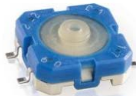
RACON 12, SMT, 4.7 \pm 0.8 N, 1 关