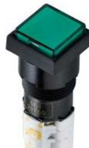
LUMOTAST 75 IP40, 发光按键, 正方形卡圈, 突起的灯罩. 声感的. 1 开 + 1 关