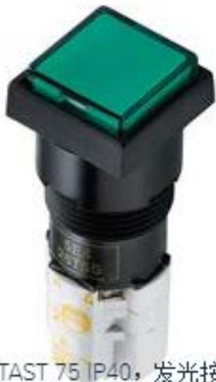
LUMOTAST 75 IP40, 发光按键, 正方形卡圈, 突起的灯罩. 声感的. 2开 + 2关