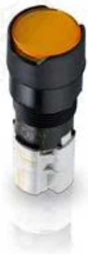
LUMOTAST 75 IP65, 发光按键, 圆形卡圈, 平灯罩. 触感的. 2 开 + 2 关