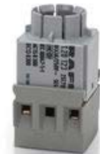
RAFIX 16, 通用触点模块, 银触, 无灯座, 螺丝接口. 2 开