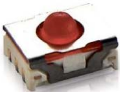
MICON 5, SMT 标准型, 5.5 N, 1 关