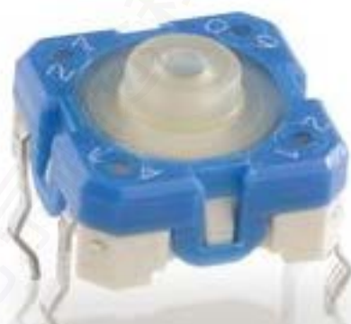
RACON 8, THT在外, 3.3 \pm 0.6 N, 1 关