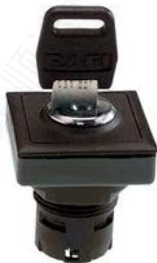
RAFIX 16 F, 钥匙开关, 正方形卡圈 1 x 40°, 触感的