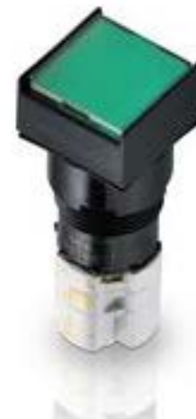
LUMOTAST 75 IP65, 发光按键, 正方形卡圈, 平灯罩. 声感的. 2开 + 2关