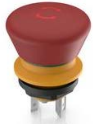
LUMOTAST 16, 急停按钮, 2 开, 银触, 快插端子 2.8 x .5, 镀锡, 复位通过旋转, 箭头 红色