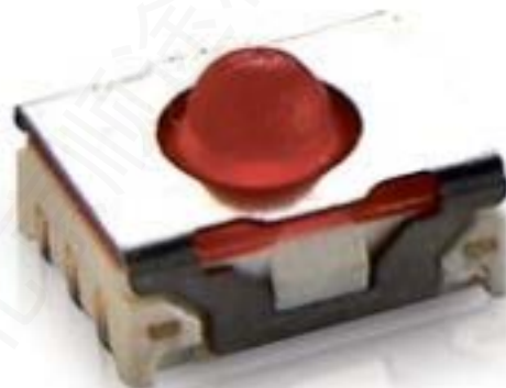
MICON 5, SMT 标准型, 3.6 N, 1 关