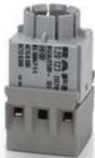
RAFIX 16, 通用触点模块, 银触, 带灯座, 螺丝接口. 用于 W 2 x 4.6d, 2 开