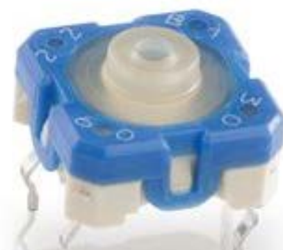
RACON 8, THT在内, 3.3 \pm 0.6 N, 1 关