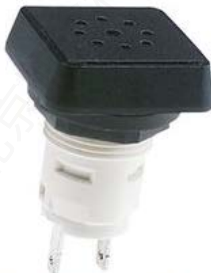
RAFIX 16, 声控信号传感器, 正方形卡圈, 70 dB