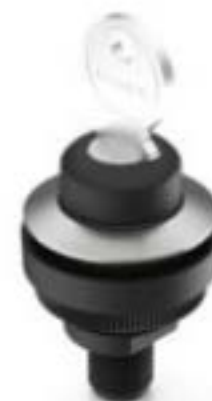
RAMO 30 K, M12, 圆形卡圈, 2 关, 金触, M12 4-极 A-编码, 前圈 不锈钢, 2 x 40°, 触感的, 拔出位置 0