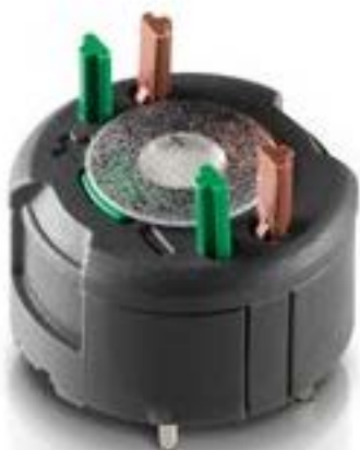
RAFIX FS 通用触点模块PCB, 金触. 用于 SMT LED, 1 开