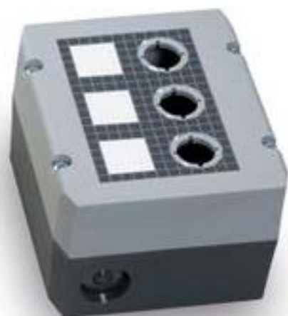
RAFIX insulated housing 16 mm, 2 mounting positions, light gray