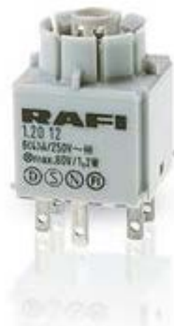
RAFIX 16, 标准触点模块, 银触, 无灯座, 快插端子. 1 开 + 1 关