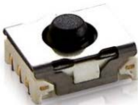
MICON 5, SMT在下方, 5.5 N, 1 关