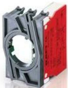
RAFIX 22 QR, 触点模块, 笼扣弹簧, 金触, 带连接器. 1 开, 1 开