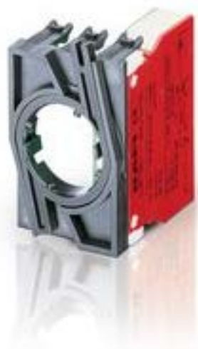
RAFIX 22 QR, 触点模块, 螺丝接口, 金触, 带连接器, 2 关