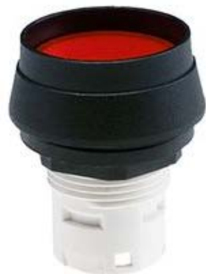
RAFIX 16, 发光按键, 突起的灯罩, 圆形卡圈 灯罩 红色