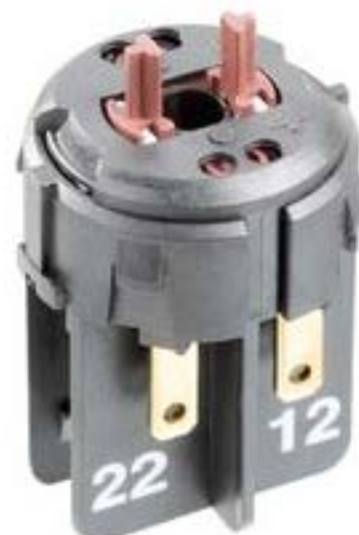
RAFIX FS 急停触点模块QC, 金触, Plus1, 2 开 + 1 关