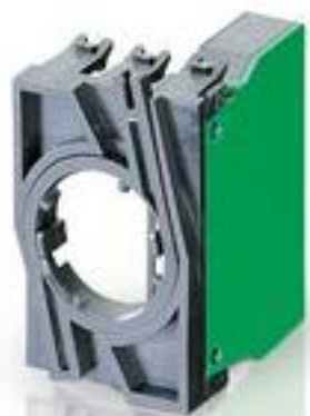
RAFIX 22 QR, 触点模块, 螺丝接口, 银触, 带连接器. 用于 BA9s. 2 关