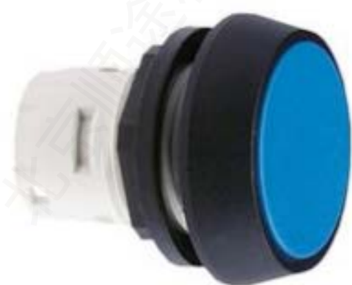
RAFIX 16, 按键, 平灯罩, 圆形卡圈 灯罩 蓝色