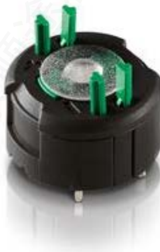
RAFIX FS 通用触点模块PCB, 银触, 用于 THT LED, 1开