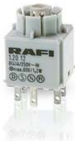
RAFIX 16, 标准触点模块, 银触, 带灯座, 快插端子. 用于 W 2 x 4.6d, 2 关