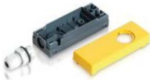
E-BOX 模块, 外壳, 250 V, 22.3 mm, 侧面 M16, 黄色