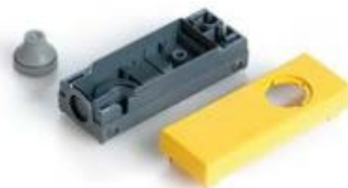
E-BOX 模块, 外壳, 250 V, 22.3 mm, 底面 M20, 黄色