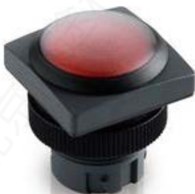
RAFIX 22 QR, 带防护罩的按键, 平灯罩, 正方形卡圈. 触感的. 前圈 黑色. 灯罩 白色