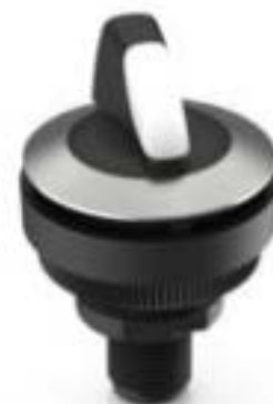
RAMO 30 S, M12, 圆形卡圈, 2 关, 金触, M12 4-极 A-编码, 前圈 不锈钢, 2 x 60°, 声感的