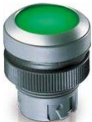
RAFIX 22 QR, 发光按键, 平灯罩, 圆形卡圈. 声感的. 前圈 银金属色. 灯 罩 绿色