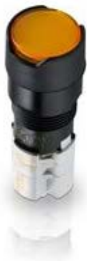
LUMOTAST 75 IP65, 发光按键, 圆形卡圈, 平灯罩. 触感的. 1 开 + 1 关