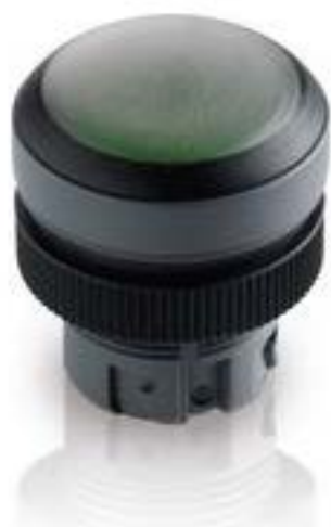
RAFIX 22 QR, 带防护罩的按键, 平灯罩, 圆形卡圈. 触感的前圈银灰色, 灯罩黄色