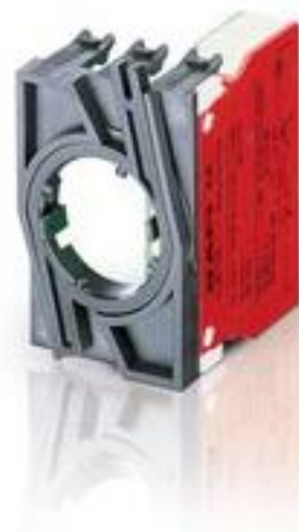
RAFIX 22 QR, 触点模块, 螺丝接口, 金触, 带连接器, 2 开