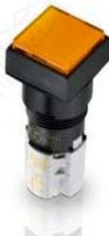
LUMOTAST 75 IP65, 发光按键, 正方形卡圈, 突起的灯罩. 声感的. 2开 + 2关