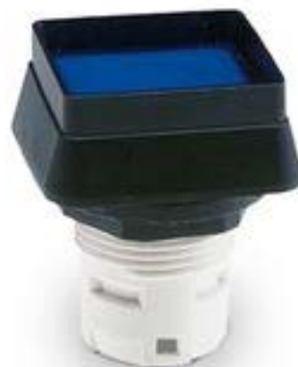
RAFIX 16, 发光按键, 突起的灯罩, 正方形卡圈 灯罩 绿色