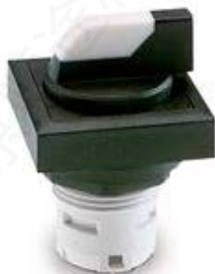
RAFIX 16, 发光选择开关, 可排列式正方形卡圈, 1 x 90°, V形, 声感的