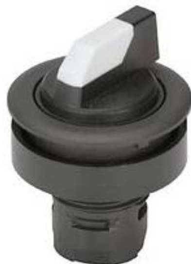
RAFIX 16 F, 选择开关, 圆形卡圈 1 x 90°, L形, 声感的