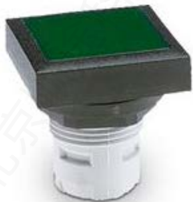
RAFIX 16, 发光按键, 平灯罩, 可排列式正方形卡圈. 灯罩 蓝色