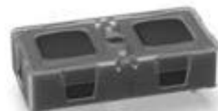
KN 19, 1关 + 1开, 9 \pm 3 N