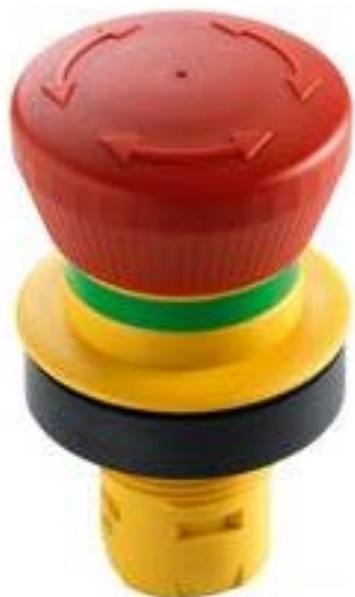
RAFIX 16 F, 急停按钮, 圆形卡圈 复位通过旋转