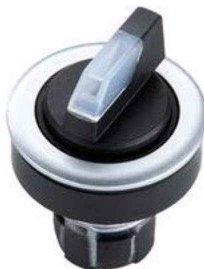
RAFIX 16 F, 选择开关, 圆形卡圈. 1 x 90°, V形. 声感的