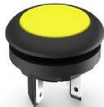
LUMOTAST 16, 发光按键, 圆形卡圈. 触感的. 前圈 黑色. 1 关. 灯罩 黄色