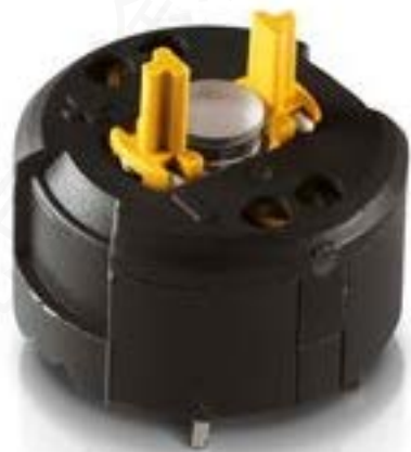
RAFIX FS 急停触点模块PCB, 银触, 用于 SMT LED, 2 开