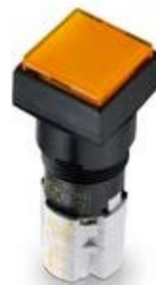
LUMOTAST 75 IP65, 发光按键, 正方形卡圈, 突起的灯罩. 触感的. 2 开 + 2 关