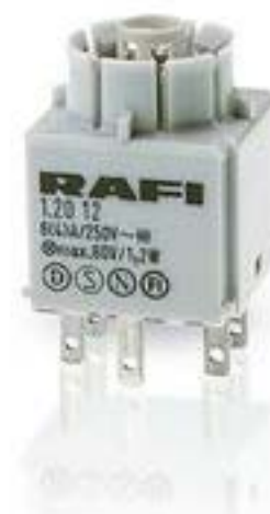
RAFIX 16, 通用触点模块, 金触, 无灯座, 快插端子, 1 关