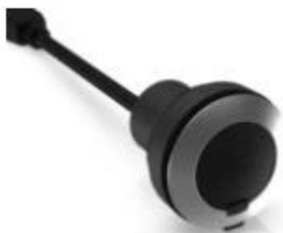
RAMO 30 F, USB, 圆形卡圈, 前圈 不锈钢, USB 3.0 型号A 带电缆55 cm