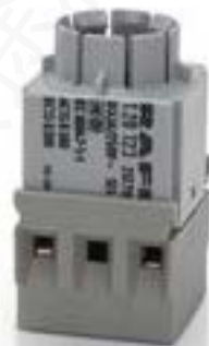
RAFIX 16, 通用触点模块, 银触, 无灯座, 螺丝接口. 1 开 + 1 关