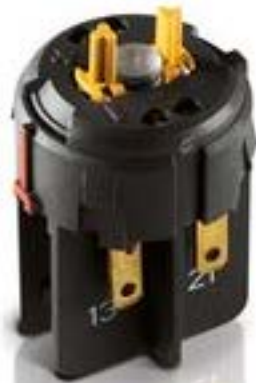
RAFIX FS QC急停触点模块, 金触, 光导体. 用于 LED-夹. 1 开 + 1 关