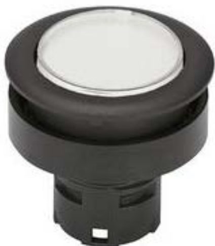
RAFIX 16 F, 发光按键, 平灯罩, 圆形卡圈 灯罩 无色