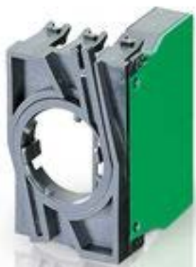
RAFIX 22 QR, 触点模块, 螺丝接口, 银触, 带连接器.用于 BA9s, 1 开