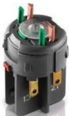
RAFIX FS QC通用触点模块, 金融, 光导体, 用于 LED-夹, 1关