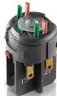
RAFIX FS 通用触点模块QC, 金融, 1 关