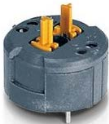
RAFIX FS 急停触点模块PCB, 金触, 用于 SMT LED, 1 开