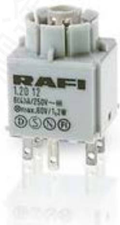
RAFIX 16, 标准触点模块, 金触, 带灯座, 快插端子. 用于 W 2 x 4.6d, 2 开