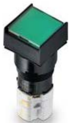
LUMOTAST 75 IP65, 发光按键, 正方形卡圈, 平灯罩. 触感的. 2 开 + 2 关