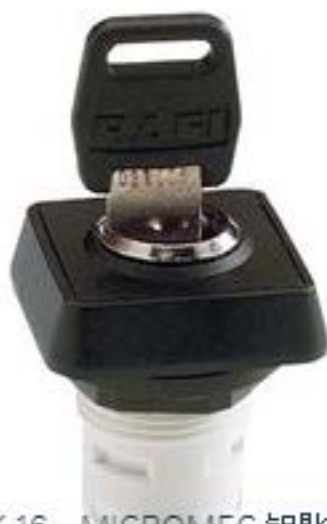
RAFIX 16, MICROMECC 钥匙开关, 正方形卡圈. 1 x 90°, V 形. 声感的. 拔出位置 0+1