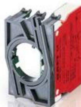
RAFIX 22 QR, 触点模块, 笼扣弹簧, 金触, 带连接器. 用于 BA9s, 1 开, 1 开