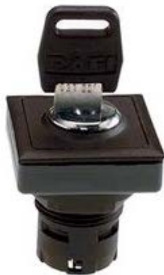
RAFIX 16 F, 钥匙开关, 正方形卡圈 2 x 90°, 声感的