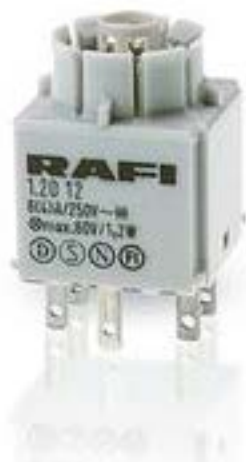
RAFIX 16, 通用触点模块, 银触, 带 灯座, 快插端子. 用于 W 2 x 4.6d. 1 关