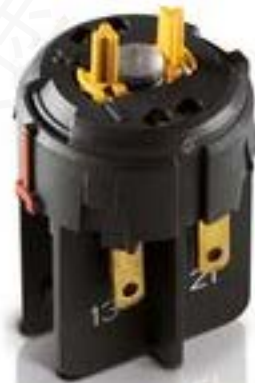
RAFIX FS 急停触点模块QC, 金触. 2 开