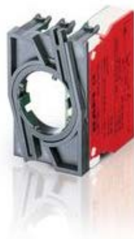
RAFIX 22 QR, 触点模块, 螺丝接口, 金触, 带连接器, 用于 BA9s, 1 开, 1 开