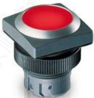
RAFIX 22 QR, 发光按键, 平灯罩, 正方形卡圈. 触感的. 前圈 银灰色. 灯 罩 蓝色