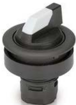
RAFIX 16 F, 发光选择开关, 圆形卡 圈. 1 x 90°, V形. 声感的