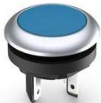
LUMOTAST 16, 发光按键, 圆形卡圈, 触感的, 前圈 银金属色, 1 关, 灯罩 蓝色