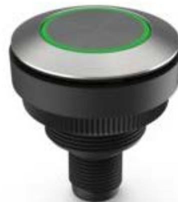
RAMO 30 T M12, 圆形卡圈, 环型 照明. 触感的. 前圈 不锈钢. 颜色 绿 色. 1 关. 灯罩 不锈钢