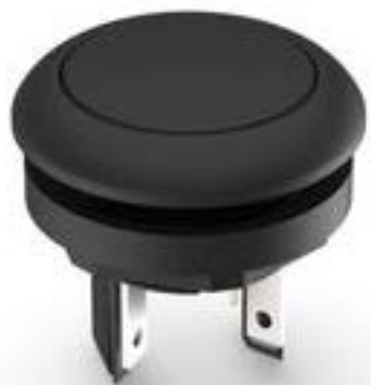
LUMOTAST 16, 按键, 圆形卡圈, 触感的, 前圈黑色, 1 关, 灯罩黑色