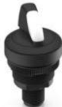
RAMO 22 S, M12, 圆形卡圈, 2 关, 金触, M12 8-极 A-编码, 前圈 黑色, 2 x 60°, 声感的