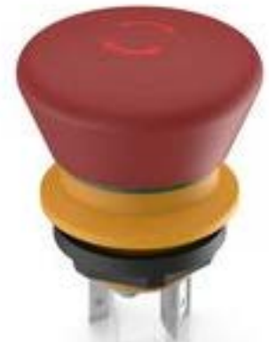
LUMOTAST 16, 急停按钮, 1 开, 金触, 快插端子 2.8 x .5, 镀锡, 复位通过旋转, 箭头 红色