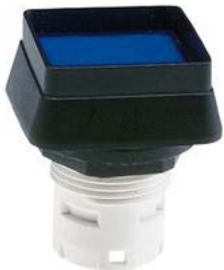
RAFIX 16, 发光按键, 突起的灯罩, 正方形卡圈 灯罩 蓝色