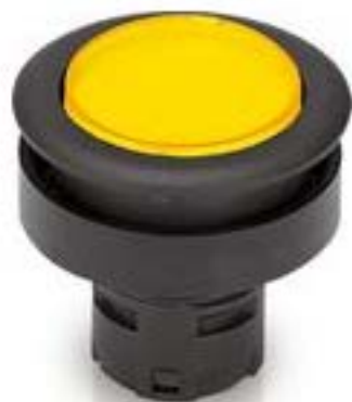
RAFIX 16 F, 发光按键, 平灯罩, 圆形卡圈, 灯罩 黄色