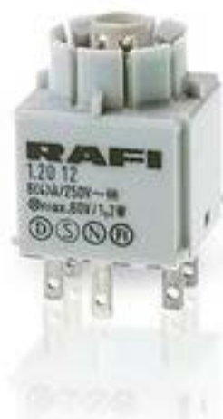
RAFIX 16, 通用触点模块, 金触, 带 灯座, 快插端子. 用于 W 2 x 4.6d. 2 开