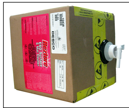
3) 打开盖子装上配套的水龙头